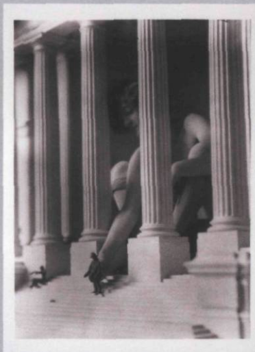
Maquette de l'annexe du Palais de justice de Montréal, Canada, Collection CCA

À la fin du cycle d'expositions Tangente , Naoya Hatakeyama présente Échelles (Scales) , trois séries photographiques commandées par le CCA et cinq photographies de maquettes puisées par l'artiste dans cette riche collection.