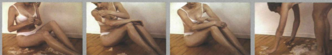
Jeanne Dunning, Extraskin (subtracking) , 1999, images fixes tirées du vidéo, DVD, 10 min. 15 sec.

VOX, image contemporaine, Montréal 3 novembre – 15 décembre 2007