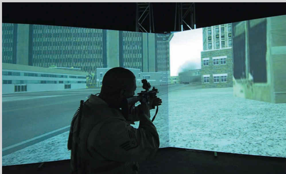
Harun Farocki, Immersion , 2009, installation vidéo, double projection, coproduction Jeu de Paume, Galerie Thaddaeus Ropac Salzbourg, Paris.

James D. Campbell is a writer on art and independent curator based in Montreal. The author of over 100 books and catalogues on contemporary art and artists, he contributes frequently to visual arts publications across Canada.