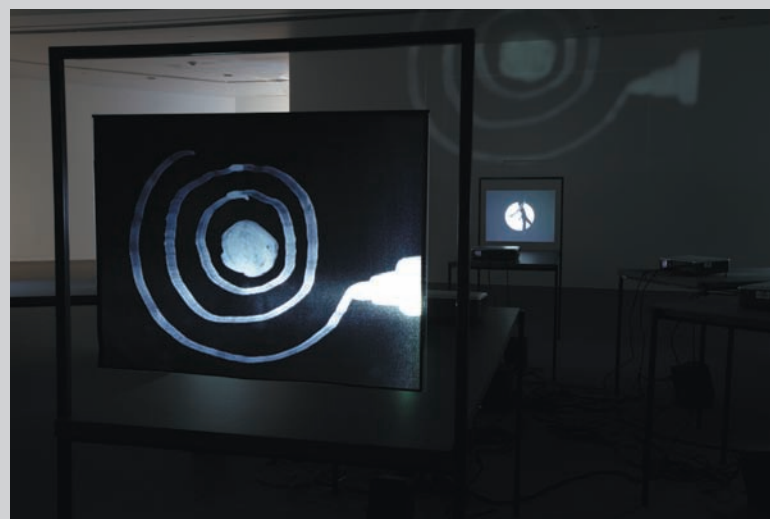
Manon De Pauw, Répertoire , 2009, video installation with six projections in loop, black and white, 3 mn 50 s, variable dimensions

These rhythms are based not only on corporeal authenticity but on the symbolic cartography of the body implicit in phenomenological discourse. This symbolic mapping of the body in the context of where it finds itself in time and space makes for a rare epiphany in the assimilation of this work. As Merleau-Ponty wrote, "What counts for the orientation of the spectacle is not my body as it in fact is, as a thing in objective space, but as a system of possible actions, a virtual body with its