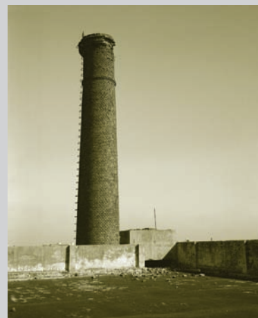
Sylvie Readman, S'absenter, 1A and S'absenter, 1B , 2009, diptych, inkjet print, archival paper.

Paul Ricoeur notes, "We must not forget that everything starts, not from the archive, but from testimony." 6 Readman's latest work provides a personal testimony that deals with a new type of landscape for the artist, one that, through recurrent use of socio-economic signifiers, transports Readman's creative landscape into another mnemonic realm that is not simply predominantly romantic but also persistently social.