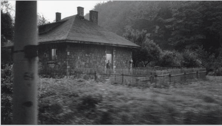
Serge Clément, Maison de Pierre / train Budapest-Istanbul, Hongrie, 2004 , DVD, 12 min.