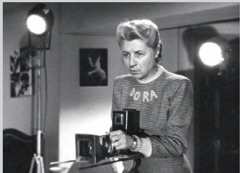
Chuck Samuels, Untitled , de la série Chuck Goes to the Movies , 2009, installation photographique, épreuves numériques, 108 photographies, 20,3 x 25,4 cm ch.

Il s'agit d'abord d'une étude de la façon dont était introduit le personnage du photographe dans le cinéma populaire des années 1900 à 1970. C'est la représenta-