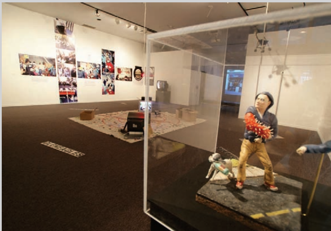
Gregory Sholette, WTO Action Collectible , 2002, figurine et affiches; John Jordan, The Clandestine Insurgent Rebel Clown Army: Operation "HA HA HA" , 2005, installation; Etcetera, To Eat, To Create! , 2008, installation