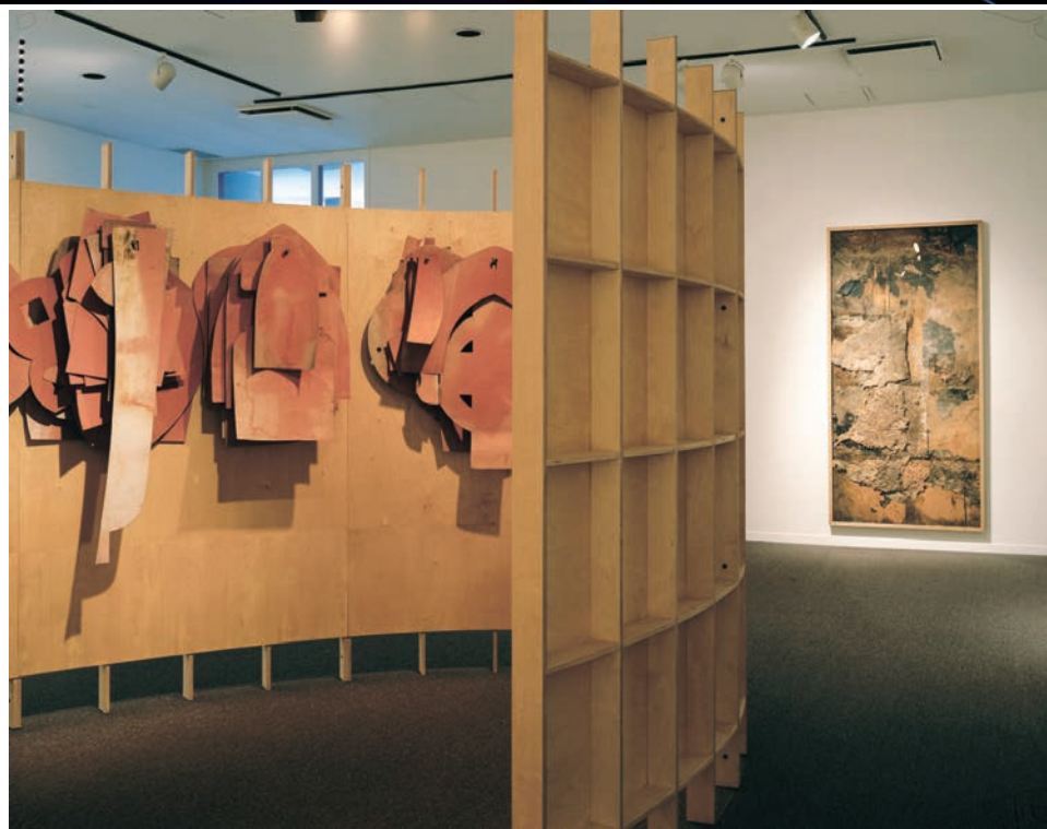
Irene F. WHITTOME , Conversation Adru , 2004. Détail/Detail. Bois, carton, métal, environnement sonore/Sound environment. 640 x 320 x 244 cm. Forman Art Gallery of Bishop's University, Lennoxville, Québec.