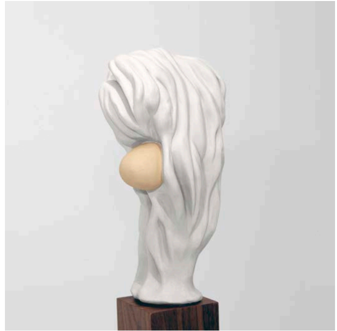
Dominic Papillon, Tête de faune , exposition Drôlerie , 2014. Plastique uréthane, bois (noyer).

Cette confusion homme-animal est clairement exposée avec l'œuvre Faramine . Provenant de l'ancien français, ce mot signifie bête fantastique. Ressemblant à un jouet, cette représentation stylisée d'un sphinx n'est pas banale. Dans son Esthétique , Hegel associe le sphinx de l'ancienne Égypte au symbolisme. Il incarne mieux que tout l'esprit encore prisonnier de la force brutale de l'animal. Toutefois, au sein de cette exposition, Faramine de Papillon semble davantage souligner, par la répétition humoristique d'une légende, le retour du sphinx détenteur d'une énigme sur ce qu'est l'humain, pour ne pas dire sur ce qu'est l'art.