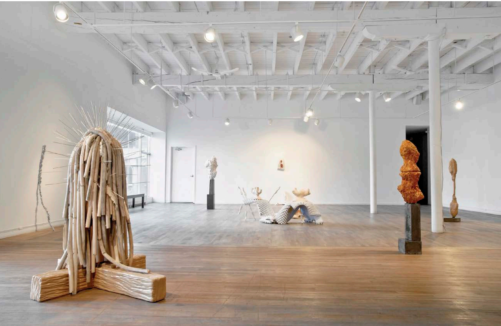
Pages précédentes/Previous pages: Dominic Papillon , Vue d'ensemble , exposition Drôlerie , 2014.