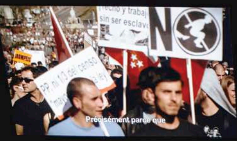
Précisément parce que