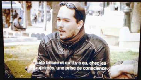
été brisée et qu'il y a eu, chez les opprimés, une prise de conscience