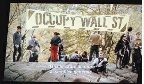
dans le cadre de notre assemblée générale.