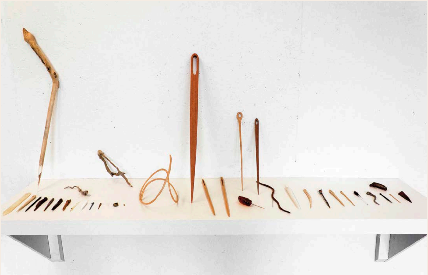
Aram Han-Sifuentes, US Citizenship Test Sampler , (100 questions and answers), 2012, present. Cotton thread on linen/Fil de coton sur lin, 244 x 21,6 x 122 cm.

l'aiguille vers le haut, transperce à nouveau le tissu et tire l'aiguille vers le bas. Chaque fil cousu crée une ligne indicielle faite de temps, de gestes et de rythme. Cela est important pour moi et pour les gens avec qui j'interagis dans ce projet de type communautaire. Nous nous servons de nos mains pour réaliser nos échantillons. Par sa lenteur, la main nous donne le temps de partager entre nous nos expériences et de réfléchir à notre situation actuelle en tant que non-citoyens. Ainsi, c'est avec nos mains que nous infusions nos pensées et notre politique dans chaque échantillon.