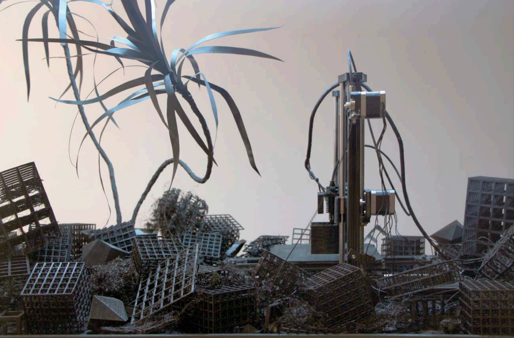
P. 36-37 : Simon Bilodeau , De l'avant comme avant , 2016. Vue partielle de l'exposition/Partial view of the exhibition.