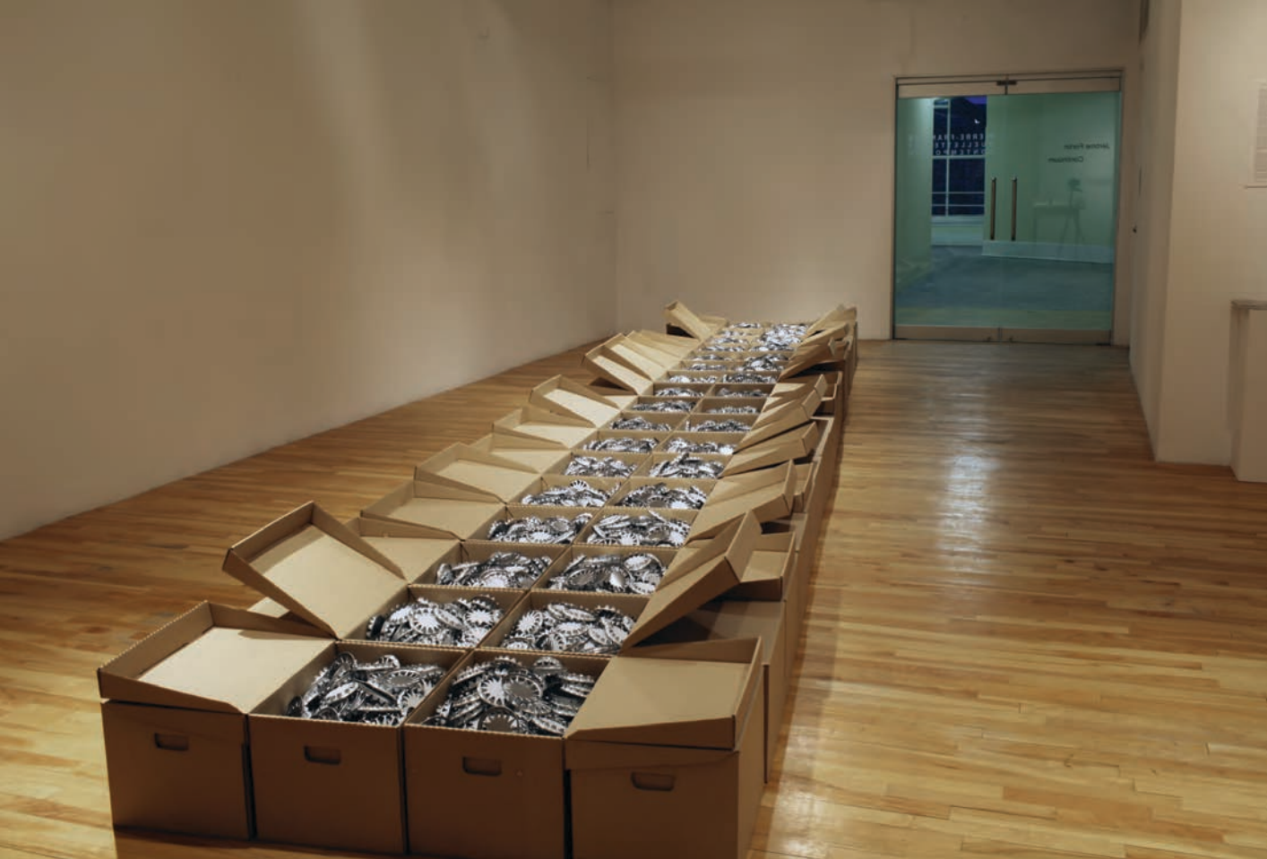
Jérôme FORTIN, Continuum , 2011. Installation.

Laramée, nous ressentirons l'agrandissement de notre propre intériorité, perdus dans nos pensées. Et la grandeur augmente au gré de l'intimité qui se creuse « quand s'assouplit la dialectique du moi et du non-moi 6 ». Bachelard insiste, « la miniature est un des gîtes de la grandeur 7 ». Dans ce jeu des limites qui s'ouvrent et se déplacent, le monde et la chair du monde, l'être et le cosmos s'entrecroisent, alors que c'est par leur immensité que l'intimité et l'infini se touchent et communient sur cette ligne d'horizon. Nous espérons dans la croissance de l'un et l'autre au fur et à mesure que ses livres sont gravés en creux, défaits, décomposés au profit d'infimes paysages reconstruits, tout petits, petits, juchés sur la tranche.