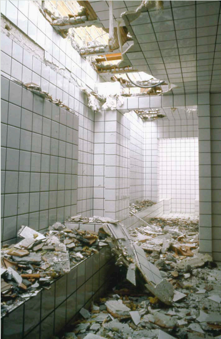
Jean Pierre Raynaud, La Maison de Jean Pierre Raynaud. Démolition de la Maison La Celle-Saint-Cloud (France), mars 1993. Avec l'aimable permission de l'artiste.

J. P. R. Avant d'être artiste, j'étais jardinier. C'est grâce à ce métier que j'ai, pour la première fois, senti la force de la série avec les plantes en culture. La série donne une puissance à ces plantes que l'on ne