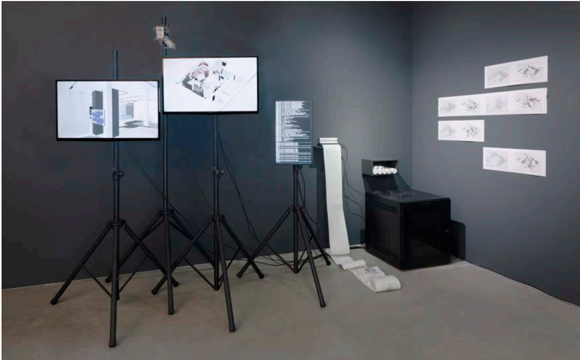
fabric | ch, Atomized (curatorial) Functioning , 2019. Dispositif automatisé d'exposition, 3 écrans, un serveur, un Raspberry Pi, une imprimante thermique, impressions.

territoires digitaux. Aujourd'hui, à travers les projets plus récents de fabric | ch, nous continuons à interroger notre espace contemporain, que ce soit dans les enchevêtrements entre notre réalité physique et notre réalité numérique ou l'émergence de nouvelles pratiques de design. À ce titre, dans notre dernier projet intitulé Atomized (curatorial) Functioning , nous nous sommes tournés vers les processus d'automatisation et d'intelligence artificielle qui prennent une place de plus en plus grande dans nos modes de travail.