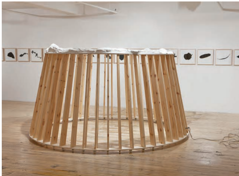
Jean-Yves VIGNEAU, Désir d'îles. Utopiae Insulae Figura . Centre d'exposition Circa, Montréal, 2012.