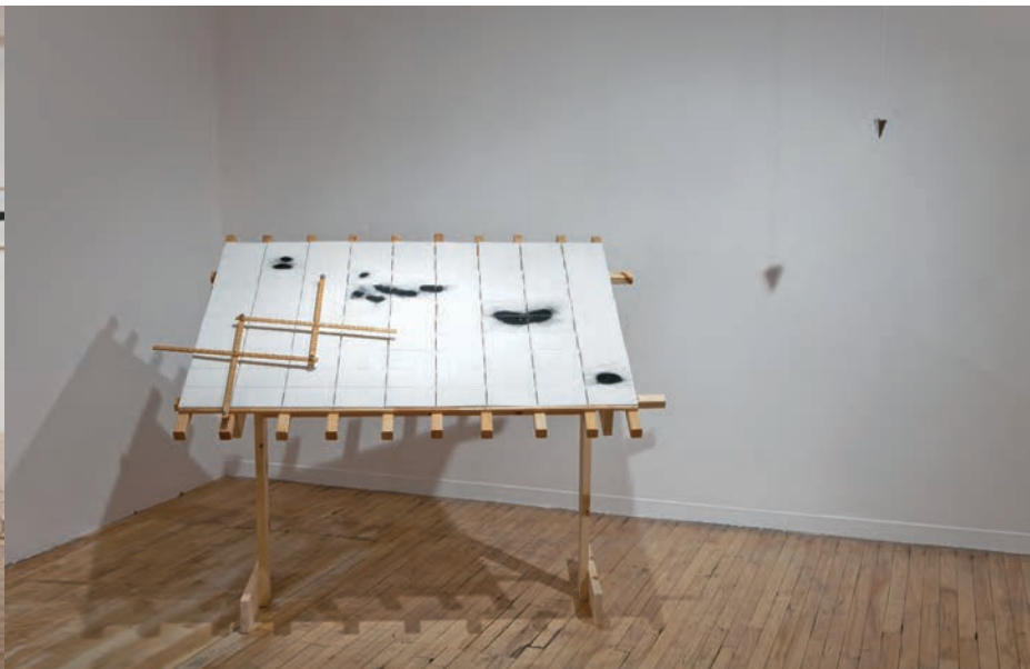
Jean-Yves VIGNEAU, Désir d'îles. Table de navigation . Centre d'exposition Circa, Montréal, 2012.