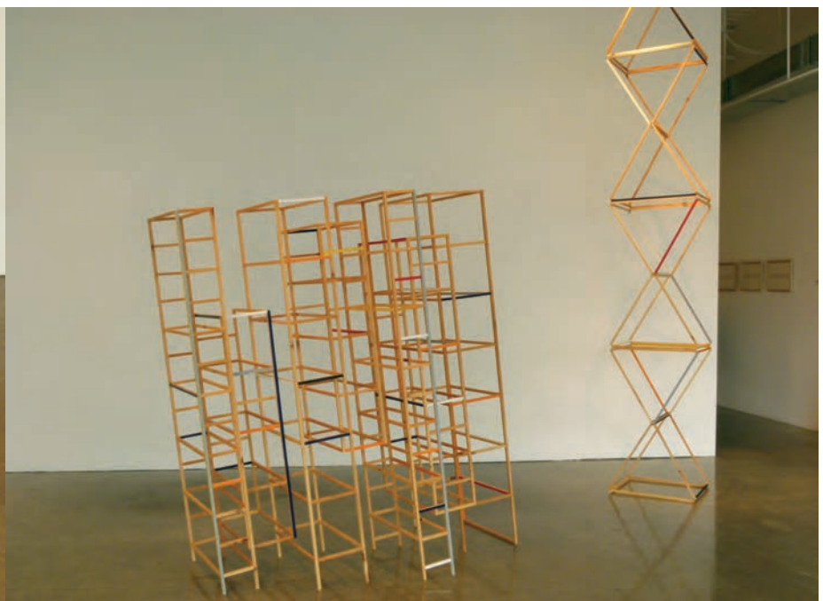
Josée DUBEAU, Light Distance , 2012. Pin. Bibliothèque : 170 x 81 x 158 cm ; colonne : 320 x 46 x 46 cm. Patrick Mikhail Gallery, Ottawa.