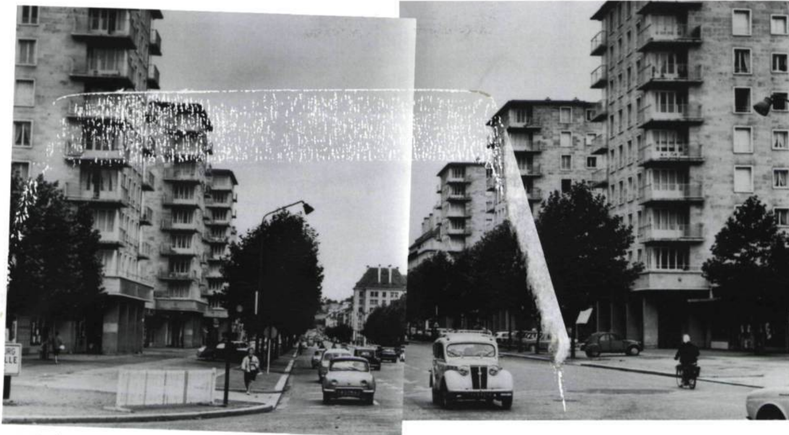
La reconstruction de Caen, 1951-1953, l'avenue du Six-Juin. L'effort d'après-guerre pour reprendre les formations classiques antérieures de la ville.