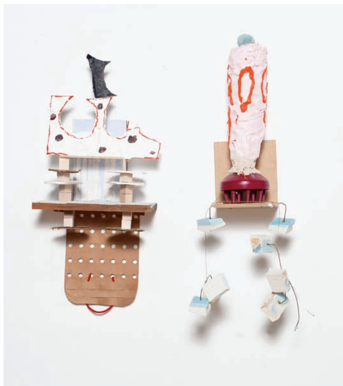
Serge MURPHY, La forme des jours , 2011. Détails. Techniques mixtes.