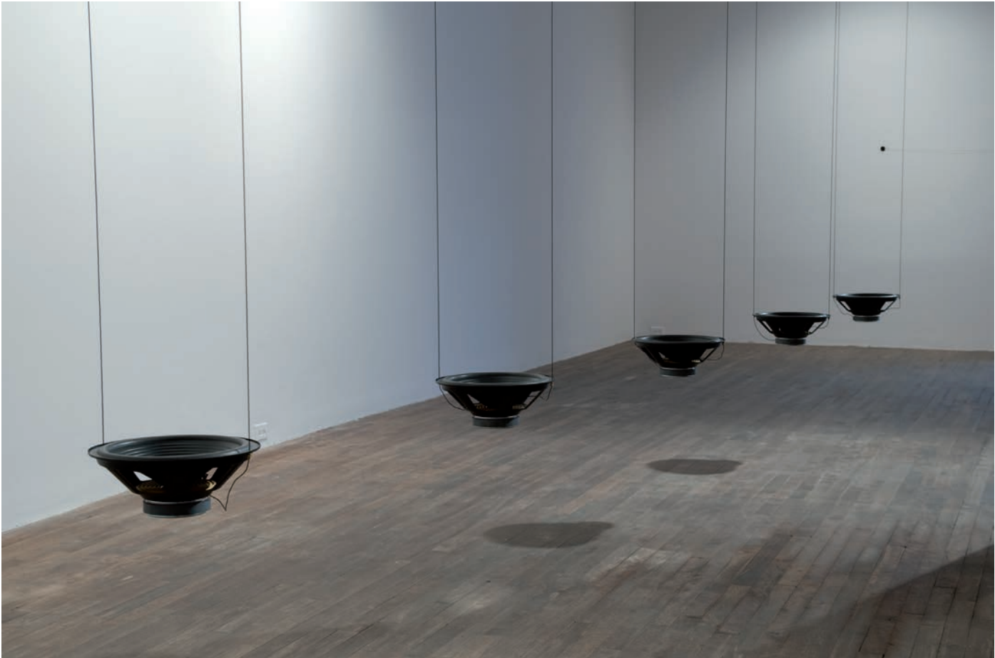
ROLF JULIUS, INSIDE, FIVE HANGING SPEAKERS, VUE D'INSTALLATION, OBORO, MONTREAL, 2008.

crâne ( Music for the Eyes ). Il lui arrive de surplomber un regroupement de petites pierres duquel émergent des sons granulaires ( Stone Field ). Les questions d'échelle surgissent des œuvres, car certaines peuvent être interprétées comme des paysages miniatures. Tout comme les sons, d'ailleurs : l'artiste décrit ses compositions en utilisant régulièrement les expressions small sounds , small music , ce qui traduit une quête de sons non spectaculaires. Petit ( small ), pour écarter le spectacle, pour se tenir à distance du spectaculaire et attirer l'attention vers le presque présent, pour privilégier la découverte, le sensible. « J'aime les petits sons parce que je ne pourrais pas faire davantage 14 », confie Julius.