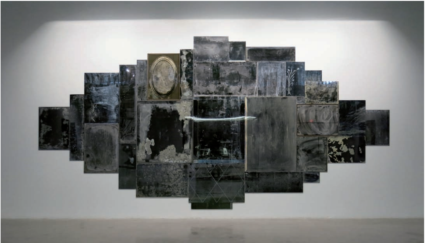
Nicolas Baier, Vanités 04 , 2013.