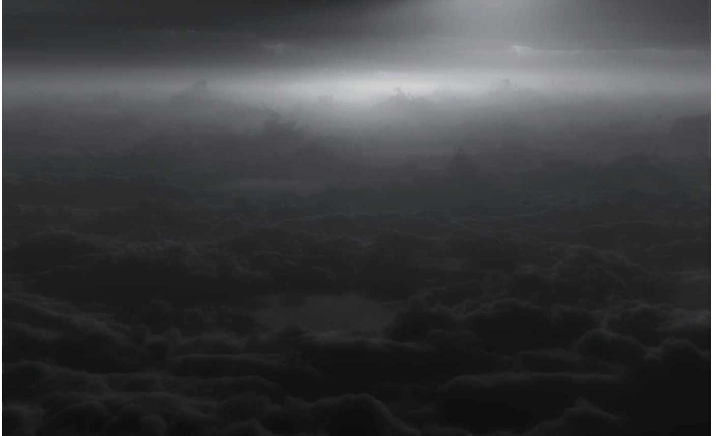
Nicolas Baier, Réminiscence 02 , 2013.