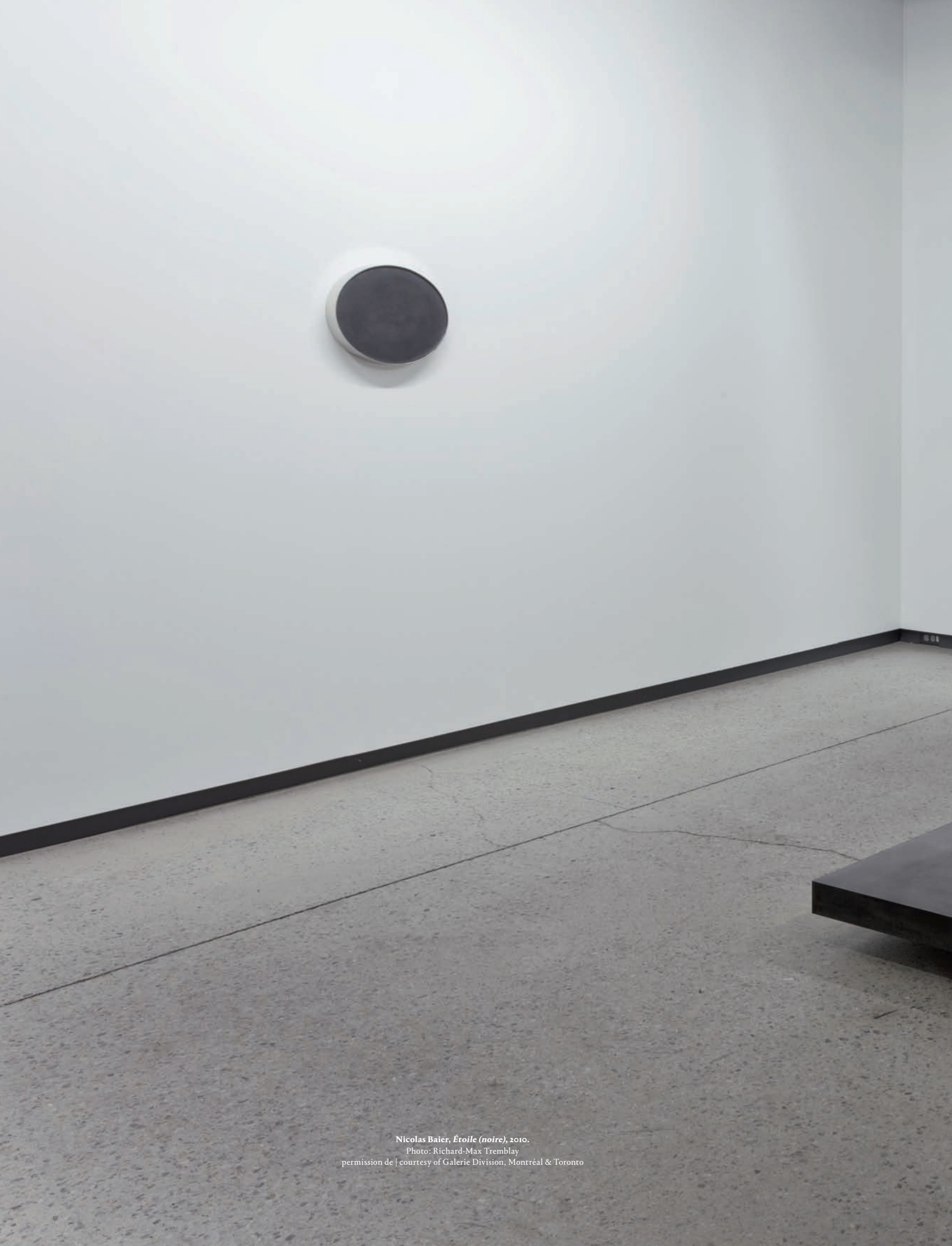
Nicolas Baier, Étoile (noire) , 2010.