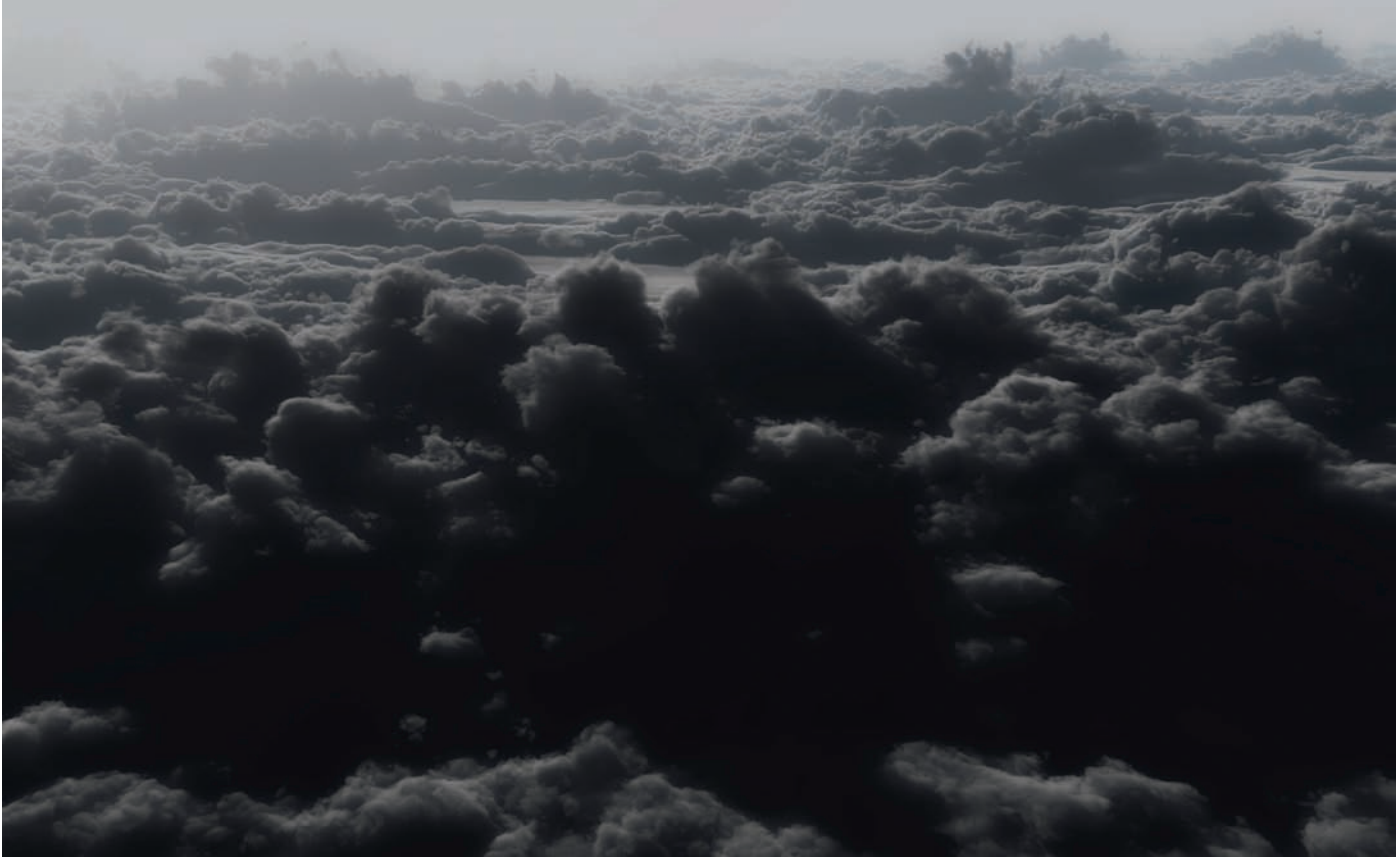
Nicolas Baier, Réminiscence , 2012. Photo: © Nicolas Baier permission de | courtesy of Galerie Division, Montréal & Toronto