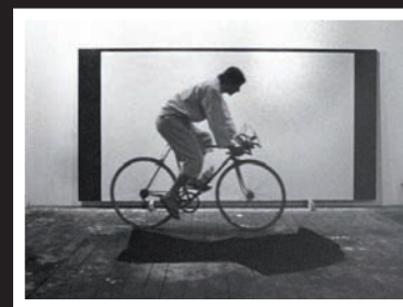
Charles Gagnon, Le son d'un espace , 1968.