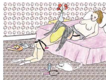
← Babe, couverture, 2015.