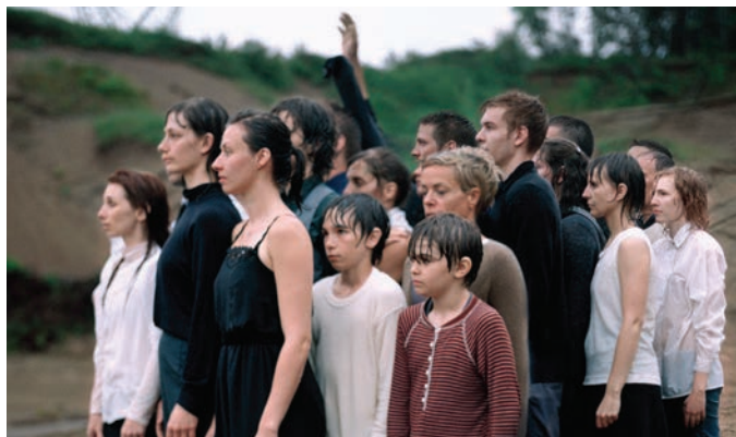
Jacynthe Carrier, Parcours , 2012.