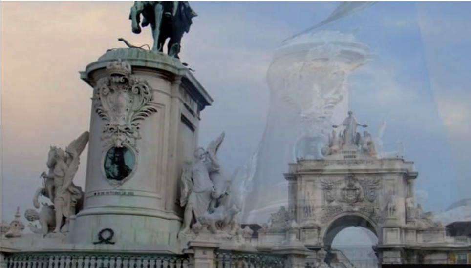
Ana Vaz Occidente, captures vidéos | video stills, 2014.