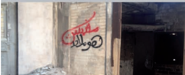
Set Picture "There is no Homeland" Arabian Street Artists