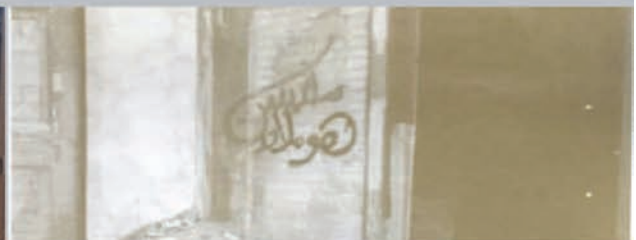
Print from the series "This Show Does Not Represent The View Of The Artist" David Krippendorff