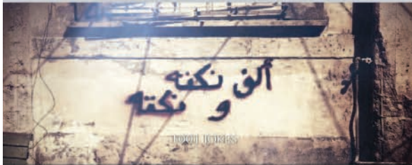
Film still "Homeland is not a Series" Arabian Street Artists