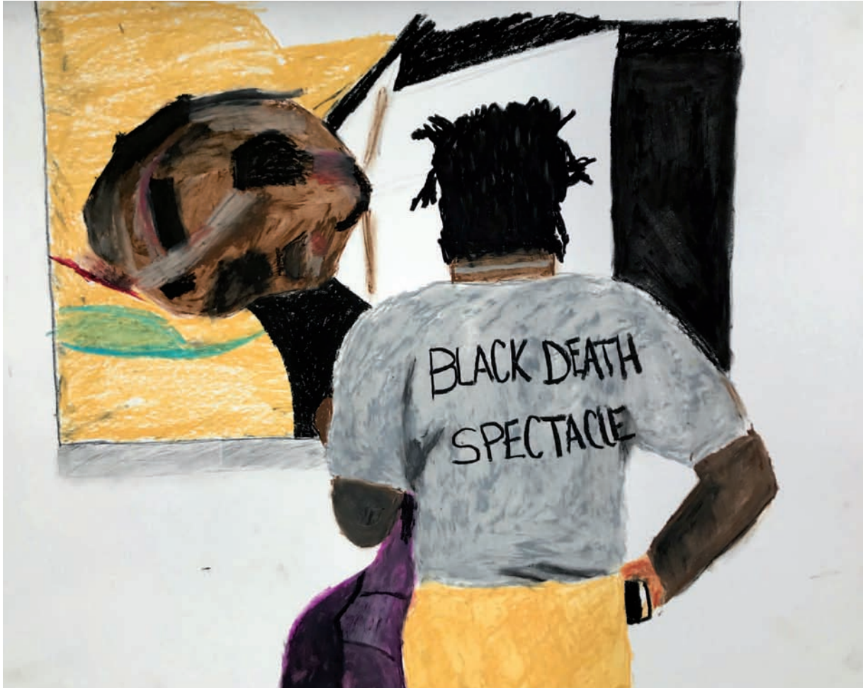
Parker Bright Confronting My Own Possible Death, 2018.