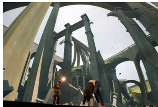
kondition pluriel, Intérieur , Société des arts technologiques, Montréal, 2011.

Contemporary dance inherits from the chiasmus between practices of the body and the exhibition of the image, metabolizing it further still by merging them into a single heterotopian poetics. 1 Like the combined presentation of Brown's visual and choreographic work at the Walker Art Center, works today are often transposed from one presentation space to another: dance is exhibited in art centres, visual arts are performed in theatres. While artists conceive of interdisciplinarity as an effective means of flouting conventions, institutional acceptance of such lateral orientations is yet another step, which choreographic culture has largely conquered. In 1999, Boris Charmatz became director of the Centre chorégraphique national (national choreography centre) of Rennes and Brittany and, with institutional backing, proceeded to adumbrate a common thread in the history of dance and the visual arts. Upon taking up his new position, Charmatz renamed the Centre chorégraphique national the Musée de la danse, changing its mission at the same time. What had been a technical training centre became—or came into its own as—a space for raising awareness of the body, as it is thought and practised, redeploying it in a trans-artistic dimension that “joyfully explodes the limits induced by the strictly choreographic field,” 2 and stirring up a broadened conception of dance that includes the culture of the image.