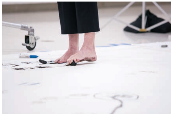
Trisha Brown, It's a Draw , Walker Art Center, Minneapolis, 2008.

De la transposition des espaces de diffusion jusqu'à la réversibilité du geste, en passant par la redescription de l'objet d'art, l'interdisciplinarité déjoue les pratiques et les représentations normatives des arts. Portée simultanément par un désir d'ouverture et une conscience autoréflexive critique, l'extension de la culture chorégraphique contemporaine se nourrit de l'exploration de ces capacités du corps et de l'image qui consistent à se laisser informer et affecter l'un par l'autre. L'une des conditions premières de cette poétique commune des arts tient à la nature de la relation nouée avec les œuvres. La danse contemporaine se définit comme un corps d'accueil qui se laisse traverser par d'autres mouvements, d'autres tensions de l'expressivité artistique, mais aussi comme un corps où se rencontrent l'intention d'un geste de création et sa réception, son interprétation. Dans les plis infimes du corps et de l'image, la poétique transversale de la danse et des arts visuels suggère la promesse d'un devenir où les arts dialogueront de manière toujours plus intime, pourvu que le regard porté sur eux continue, lui aussi, à faire l'expérience de son propre potentiel mobile.