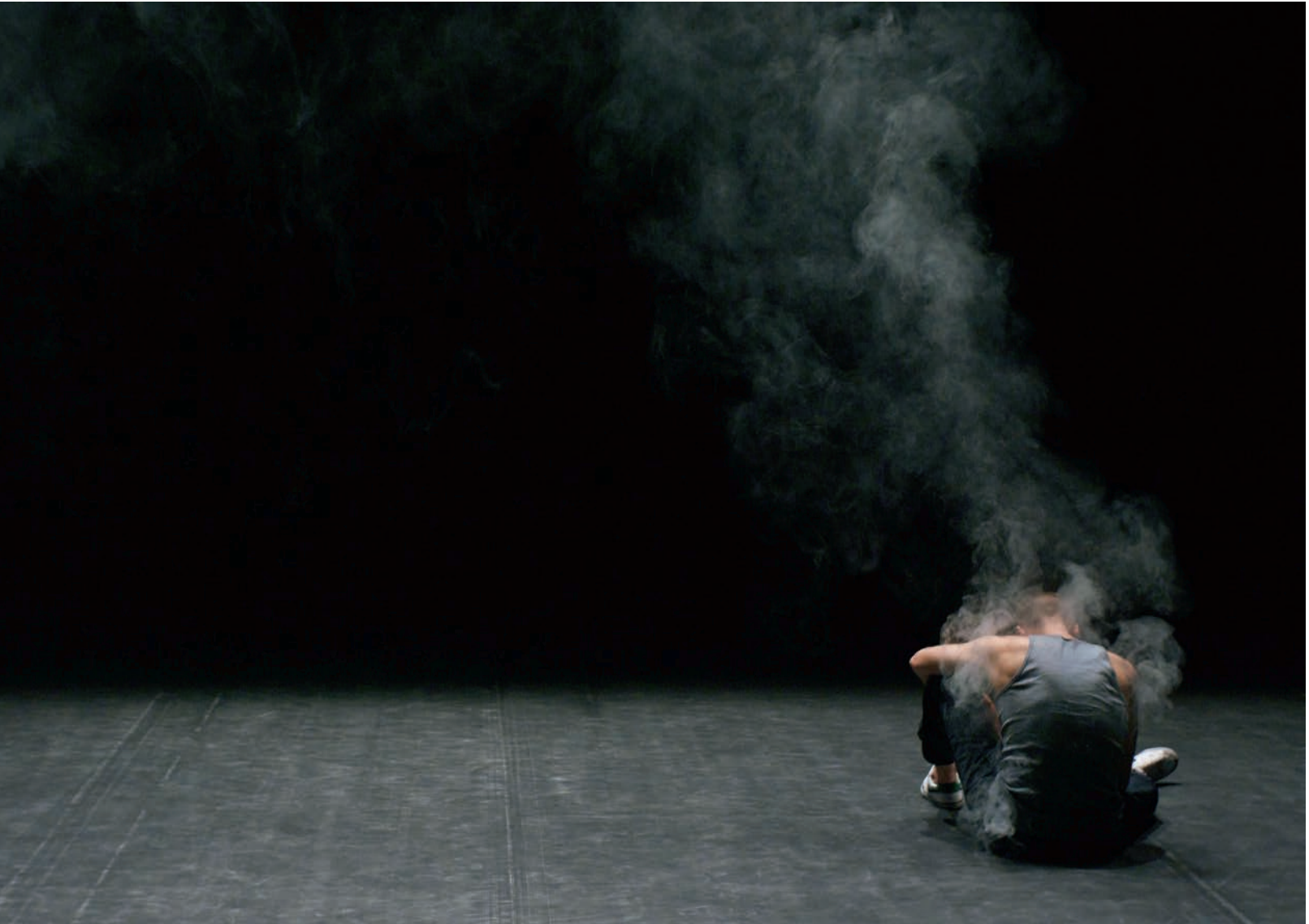
Rachid Ouramdane, Sfumato , 2012.

l'exposition, « Notes de mise en scène 4 ». La labilité des terminologies critiques supposées spécifiques à chaque art nous amène à évoquer plus précisément les modalités du dialogue entre le corps et l'image tel qu'il s'opère au sein même des œuvres. Chorégraphe contemporain prolifique, Rachid Ouramdane est un représentant actif d'une telle conception élargie de la danse, selon laquelle son territoire s'étend dans celui de l'image – à moins qu'il n'en provienne? Pour la Biennale de la danse de Lyon, en 2012, il intitule sa création Sfumato , du nom de la technique picturale de floutage des contours des figures, dont il reprend le principe comme mode de composition chorégraphique. Sur une scène inondée d'une brume artificielle, les limites des corps des danseurs se floutent et se diluent pour faire émerger de ces images troubles une réflexion symbolique sur le territoire et l'identité.