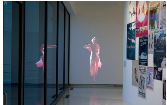
Trisha Brown, So That the Audience Does Not Know Whether I Have Stopped Dancing, Walker Art Center, Minneapolis, 2008