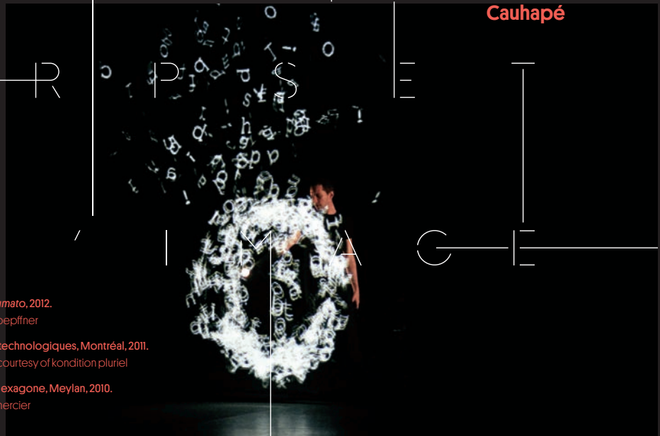
Rachid Ouramdane, Sfumato , 2012.