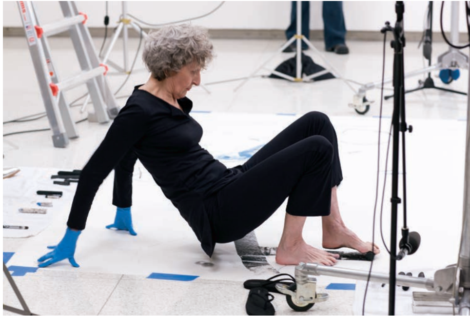
Trisha Brown, It's a Draw, Walker Art Center, Minneapolis, 2008.

Trisha Brown: So That The Audience Does Not Know Whether I Have Stopped Dancing. C'est sous ce titre provocateur que le Walker Art Center de Minneapolis organise en 2008 une rétrospective du parcours de l'une des artistes les plus renommées de la scène postmoderne, regroupant des représentations de quelques-unes de ses plus importantes chorégraphies et un grand nombre de ses productions graphiques. Titre provocateur, certes, mais aussi représentatif de la posture esthétique subversive de Trisha Brown et, avec elle, de toute une génération d'artistes dont les expérimentations avant-gardistes ont toujours des résonances de nos jours.