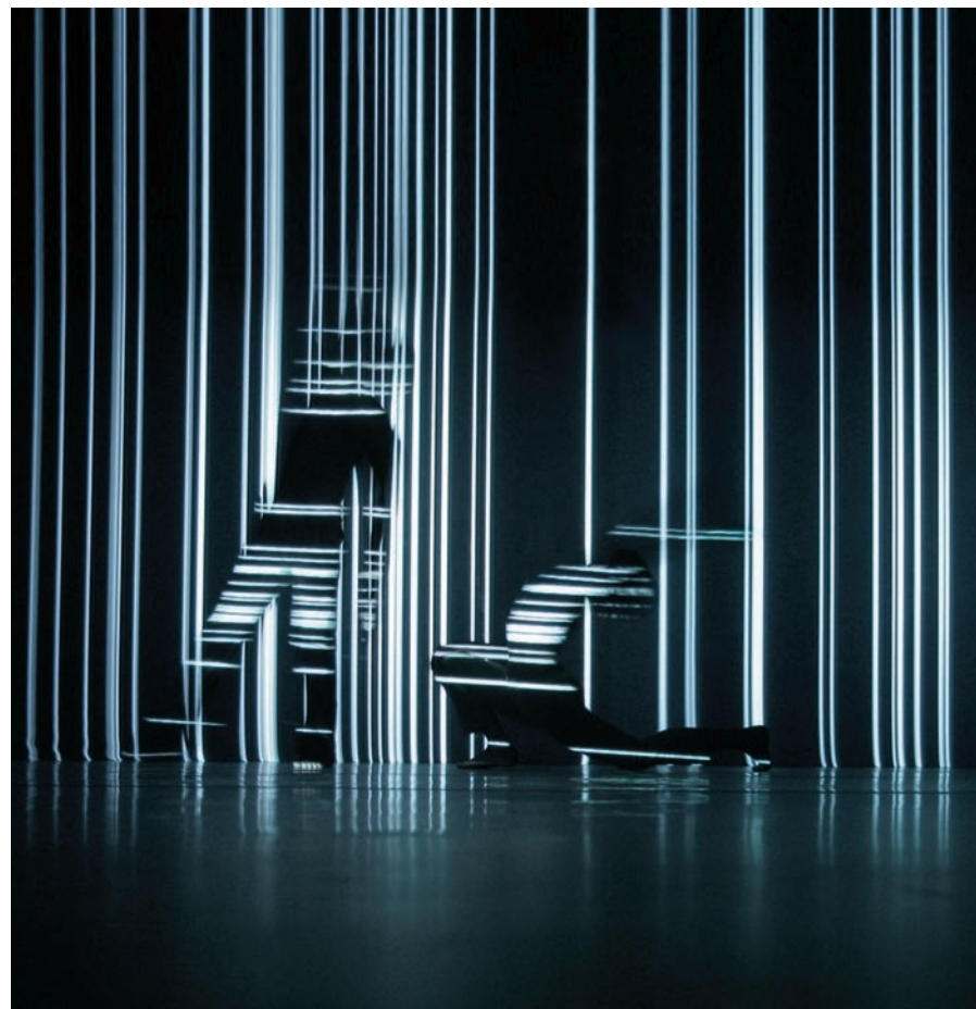
Klaus Obermaier, Apparition , 2004.