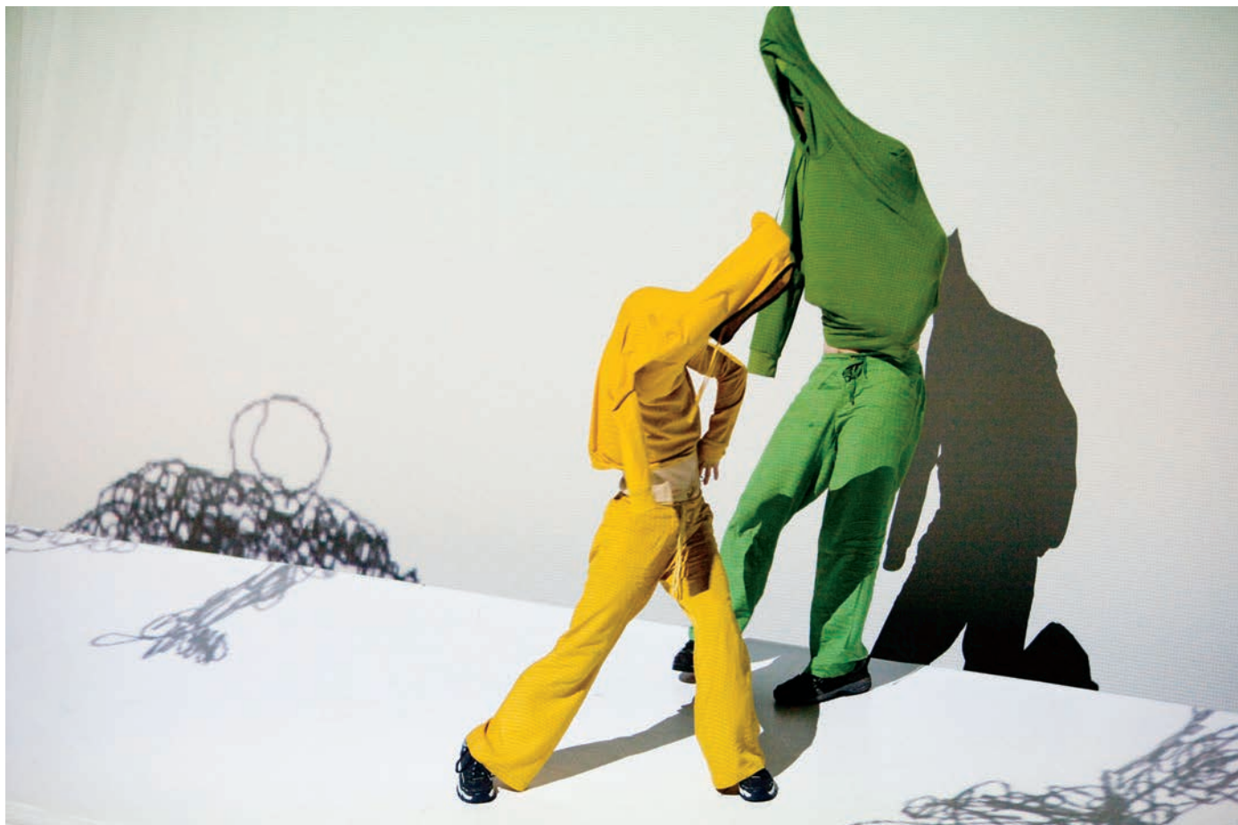
Benoît Lachambre, Is You Me , 2008.

Saburo Teshigarawa emploie des projections sur trois côtés, et danse à l'intérieur d'une énorme boîte lumineuse. Bien qu'il ne serve pas à la projection d'images iconiques, ce dispositif scénique n'est pas sans évoquer la technologie CAVE ( Cave automatic virtual environment ), employée pour l'immersion en réalité virtuelle, au MIT et ailleurs. Grâce aux technologies numériques, l'interdisciplinarité devient souvent affaire d'interactivité en temps réel, et l'on peut jouer des arts entre eux comme on le fait des instruments musicaux dans le jazz, voire confier à un programme informatique la tâche de concerner, en une seconde, divers éléments du spectacle, suivant une série de paramètres prédéterminés. Par exemple, dans Apparition (2004) de Klaus Obermaier, un système de vision artificielle capte la forme du danseur, ce qui permet d'ajuster les projections sur le danseur en temps réel, le corps-écran étant en métamorphose continue. S'ajoute à cette projection sur écran dansant, une deuxième qui couvre le fond de scène; la précision du contraste entre les deux projections est saisissante.