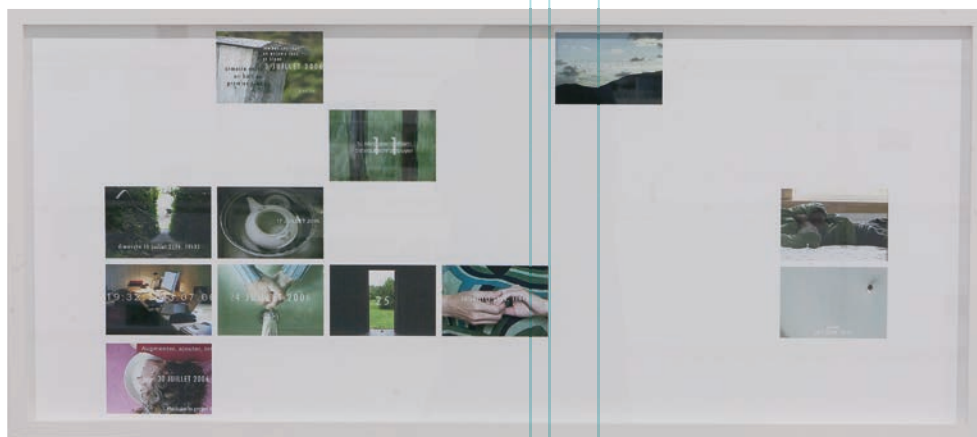
Claire Savoie, Aujourd'hui (dates-vidéos, calendrier) , vue partielle d'installation | partial installation view, 2011.