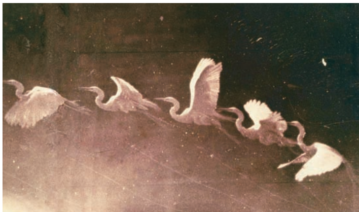
Couverture de l'ouvrage Animism , vol. 1, dirigé par Anselm Francke, copublié par Sternberg Press (Berlin), Extra City (Anvers), et Museum of Contemporary Art (Anvers), 2010. Œuvre en couverture : Étienne-Jules Marey, Vol d'héron , ca. 1883.

On apprend ainsi des participants que dans un monde où « plus personne n'est à l'abri » et où « les abstractions sont réelles, ou du moins assez réelles pour qu'on puisse en tirer profit », il faut savoir « capturer la méfiance » et « profiter de l'anxiété régnant sur les marchés ». Non sans humour, un oracle au service de la Delphi Investment Bank nous révèle que « la finance veut prédire le futur »; dans la même foulée, un spéculateur nous confie que chaque matin, il se demande : « qu'est-ce que le marché veut de moi aujourd'hui ? ». Durant une séance particulièrement dynamique, les participants rêvent tout haut « d'un langage à haut rendement pour la finance », qui s'avère être une langue dans