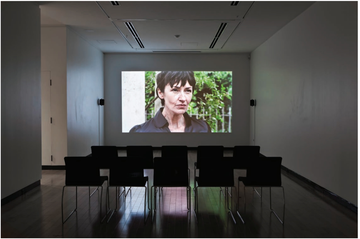
Melanie Gilligan, Popular Unrest , 2010. Avec l'aimable autorisation de Justina M. Barnicke Gallery. Photo : Toni Hafkenschedl.

ce qui est exploité dans le capitalisme cognitif, c'est le travail sur soi en tant qu'il permet aux assemblages hétéroclites dont chacun est fait de se rendre disponible aux injonctions de l'économie 8 . »