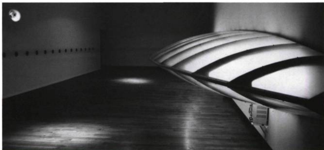
Michael Hardesty, Installation view, Nimbus . Photo: courtesy of the Germans Van Eck Gallery, New York

over the speakers. Looking up, down, and around, searching for something, taking it all in, it reflects the viewer's effort, giving no clue as to its provenance (a seamless finish blends a video monitor into the wall).