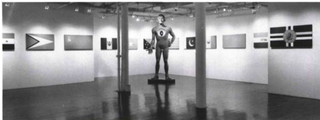
Jonathan Borofsky, installation à la Paula Cooper Gallery, 1988.