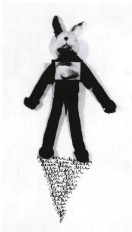
Annette Messenger, Mes petites effigies , 1988. Détail