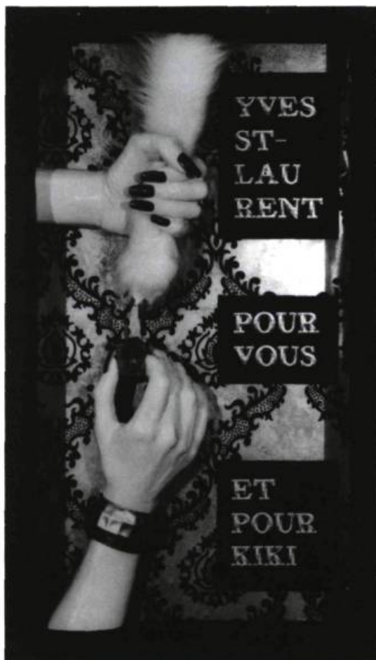
Paul Grégoire, Kiki , 1989. Techniques mixtes; 33 x 56 cm Collection À l'Ombre du génie .

C hose certaine, les foires d'art contemporain sont de plus en plus nombreuses. Pour la plupart d'entre elles, le terme «art contemporain» englobe une multitude de courants artistiques qui ont vu le jour depuis le début du siècle. À l'image de grandes galeries renommées, ces foires présentent donc une variété de tendances dont on pourrait interroger les liens entretenus avec une définition rigoureuse du vocable «contemporain» (de l'art russe du début du siècle au cubisme, de l'impressionnisme au surréalisme, de l'abstraction lyrique à l'art pop, etc.). En regard de la tradition (et d'une constante éducation à faire), il ne faut pas se surprendre de cette forme de cohabitation de différents genres qui répondent secrètement aux attentes d'un marché. Mais pourtant, chez nous, nous avons la possibilité de nous libérer de ces contingences historiques compte tenu du fait que notre marché a démarré au milieu de ce siècle et que les valeurs dites «contemporaines» se trouvent de plus en plus près d'un jeune groupe de collectionneurs récemment formé. Cet avan-