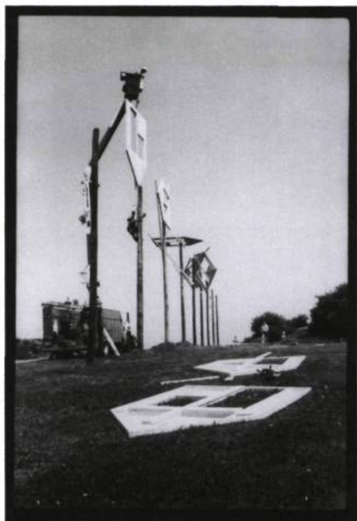
Territoires d'artistes : Paysages verticaux. Installation du projet de Melvin Charney (Montréal). 23 juin 1989.

fermeture temporaire du Musée du Québec pour montrer quelques œuvres buissonnières.