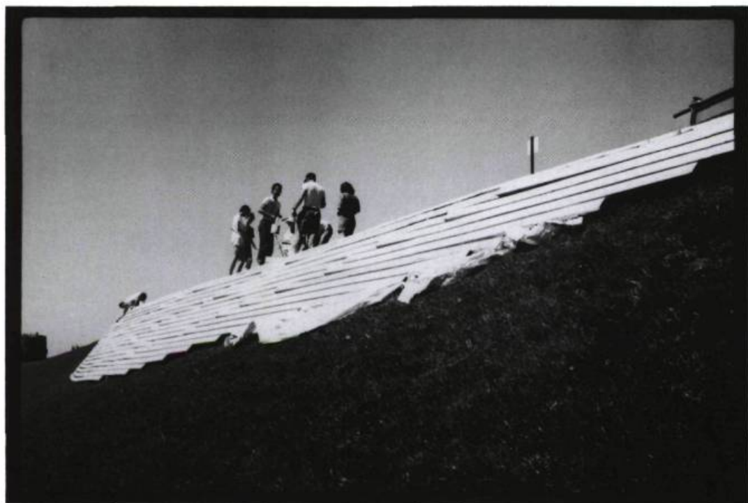
Territoires d'artistes : Paysages verticaux. Installation du projet de Robert Stackhouse (New York), 24 juin 1989.

Territoires d'artistes : Paysages verticaux, Musée du Québec, Québec, du 15 juin au 1 er octobre 1989 —