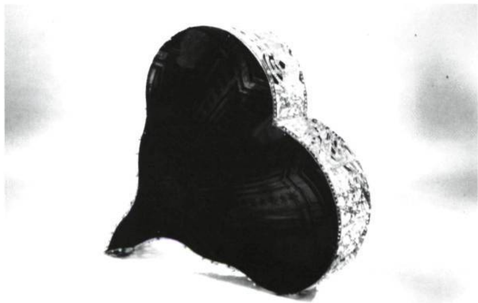
Pat Bruder, Nourounihou , 1989. Meccano, peinture, photo transparente, plexiglas; 110 x 0,89 x 0,21 cm

D epuis ses premières expositions au début des années 80, Pat Bruder élabore un langage mixte combinant formes et images. Les objets qu'il conçoit se définissent dans un entre-deux sculpture/architecture et fonctionnent comme les récepteurs d'une information. Travail des tensions souvent aux limites du vertige baroque porteur d'anxiété: formes sophistiquées menées à un ultime point d'équilibre, couleurs subtiles, goût pour l'architecture classique du XVII e siècle français ou pour celle du Bernin ou de Borromini.