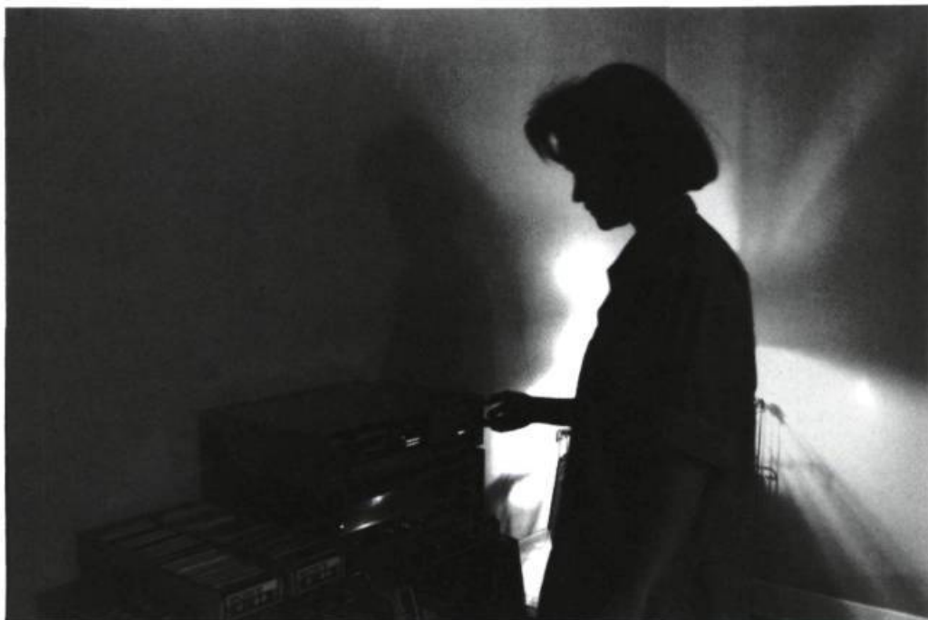
Raymonde April, La Musique de la série Tableaux sans fond , 1985

du Book of Gates ) et les mises en scène intericonographiques de Sorel Cohen, issues de An Extended and Continuous Metaphor . Là où le bât blesse, c'est que le voisinage, dans le libellé du titre, du «conceptuel» et de l'«esthétisant» ne va pas de soi! La réunion semble obéir davantage à une difficulté définitionnelle qu'à une réelle parenté entre les deux approches. Sans parler du caractère légèrement péjoratif que peut revêtir l'épithète «esthétisant», surtout lorsque l'on sait combien le seul terme d'«esthétique» peut avoir mauvaise presse!