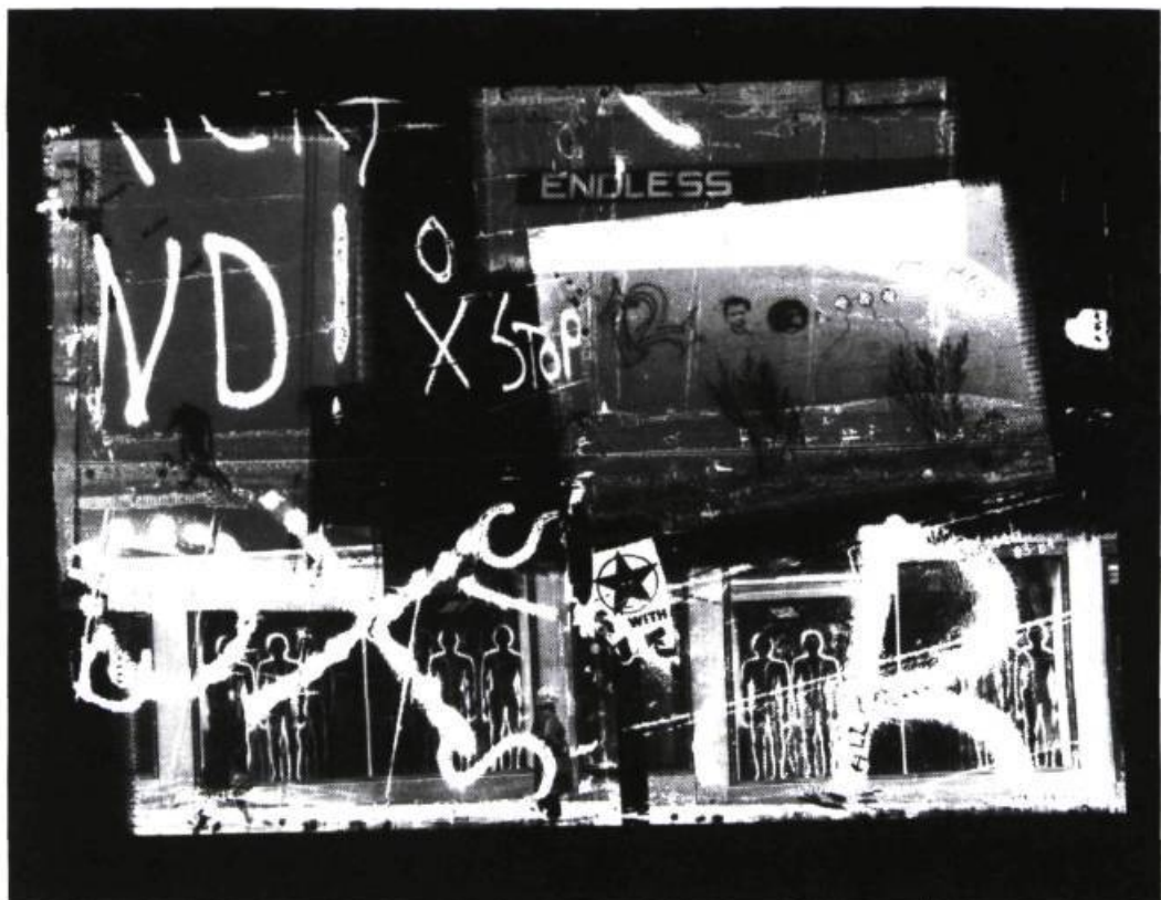
Cheryl Sourkes, Arrêt continu de la série De la Différence perdue et recouvrée , 1985. Épreuve argentine à la gélatine; 50,5 x 60,4 cm

Mirabile Visu, événement célébrant le 150 e anniversaire de la photographie, Québec, du 1 er au 26 novembre 1989 —