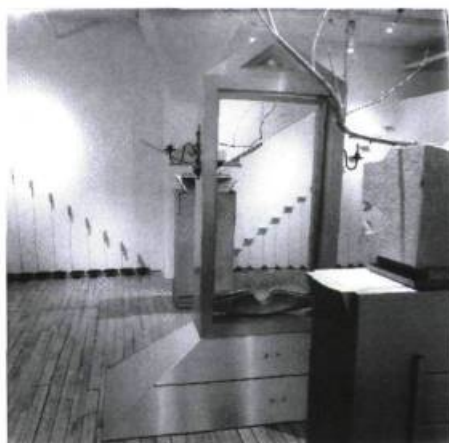
Michèle Tremblay Gillon, Psyché , 1991. Vue de l'installation.