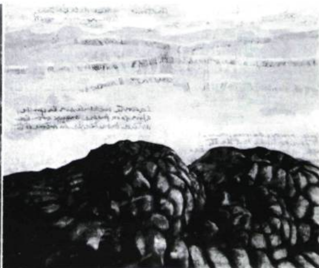
Richard Deschênes, Anatomie , 1991. Acrylique sur toile ; 105 x 165 cm.

place d'un monde énigmatique, l'unique est prescrit dans la pseudo-uniformité des détails ornementaux.