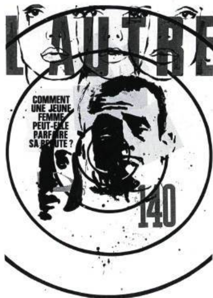
Pierre Ayot, L'autre , 1967. Gouache et collage; 66 x 51 cm. Galerie Graff, Montréal.

fausses projections d'images, dont le point de vue idéal est inaccessible ou impossible : Écran de projection Y. C. (1980), Una giornata al sole , Certes l'art est un jeu (1983), etc.