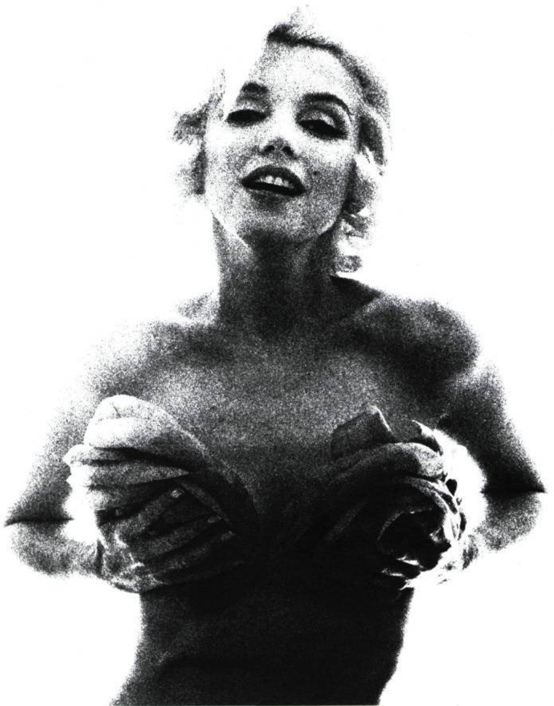
Bert Stern, Marilyn , 1962. Épreuve argentique à la gélatine, mise en couleur, colonisée de surcroît à la main. Tirage de 1992, New York, collection particulière.

différents, les divers types de communication visuelle ne partagent pas les mêmes présupposés ou fonctions, ni les mêmes potentialités de représentation. Ils appartiennent à des univers sémiotiques différents lesquels, plus souvent qu'autrement, sont en décalage ou en contradiction complète les uns par rapport aux autres. Même si elle circule aisément, une formule telle « la culture visuelle » est une construction purement verbale qui ne peut servir de point de ralliement à l'analyse des œuvres d'art visuelles.