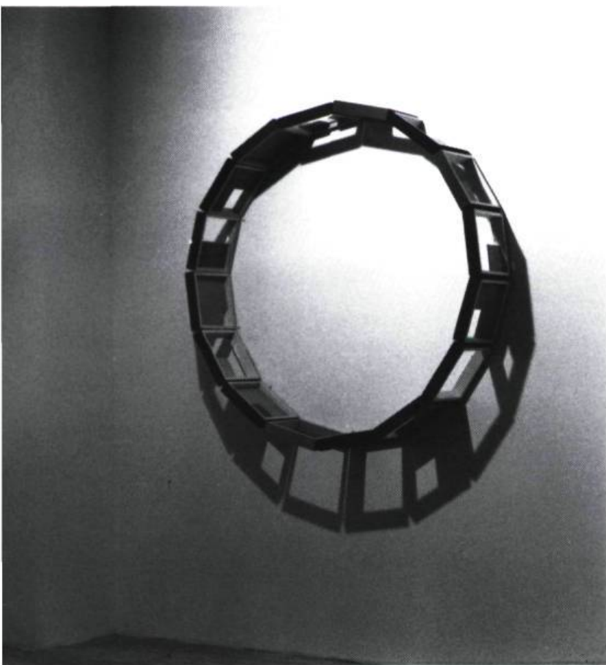
Luc Bergeron, Toujours , 1994. Pigments sur bois; 16 pièces de 33 x 33 cm. (pièce circulaire)

Plage (1993) et Toujours (1993) figurent parmi les assemblages les plus complexes et regroupent seize de ces panneaux réversibles (33; 33 cm). Dans Plage , les carrés, boîtes ou écrans, à dominante bleue et noire, font alterner la disposition aléatoire des figures en creux ou dessinées, évoquant des étoiles, des algues, des têtards, des fruits et des coupes. Le relief et l'ombre révèlent, comme des marées, les mouvements de ces formes évidées par le mur ou creusées par le dessin. Toujours pousse plus avant les mises en espace. Les boîtes-tableaux peuvent être empilées et proposent ainsi une sculpture murale faite de la superposition des bandes colorées des côtés. Elles sont aussi disposées en cercle et la lumière viendra alors en révéler les formes découpées, dessins qui courent sur le mur comme la lanterna magica . Les combinaisons s'ajustent aux variations de l'espace et de la lumière, au plaisir d'un accro-