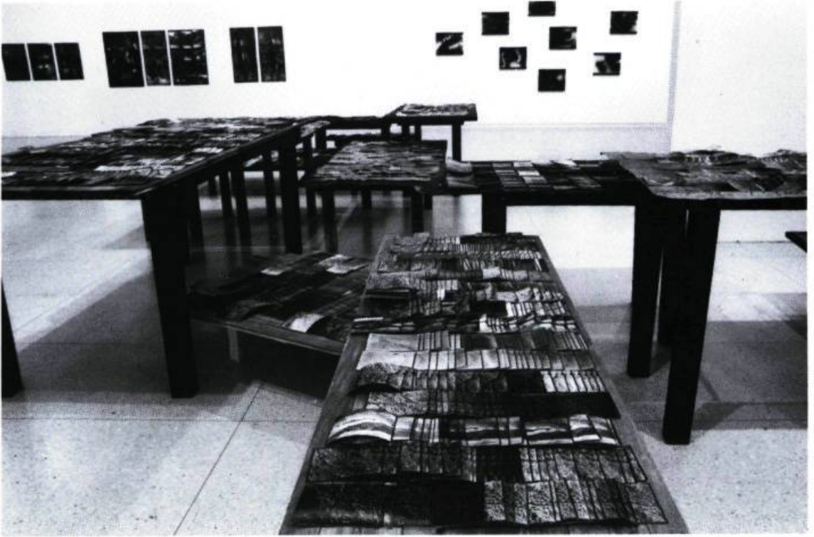
Eugénie Shinkle et Stéphane Vermette, Paysage taxinomique , 1995. Épreuves argentiques, bois métal.

gélifiée qui, on le constate au contenu jauni et plus trouble de certains, vieillit et dépérit, marquant sur chacun d'eux le passage du temps. La photo — de famille, de photomaton, de journal — sert en quelque sorte d'étiquette à ces contenants devant lesquels on s'arrête comme devant un mur d'inscriptions funéraires : on fouille les visages comme les patronymes à la recherche d'un individu connu ou d'un parent, on crée différents réseaux, contribuant ainsi nous-mêmes à motiver le rassemblement et à nous y situer.