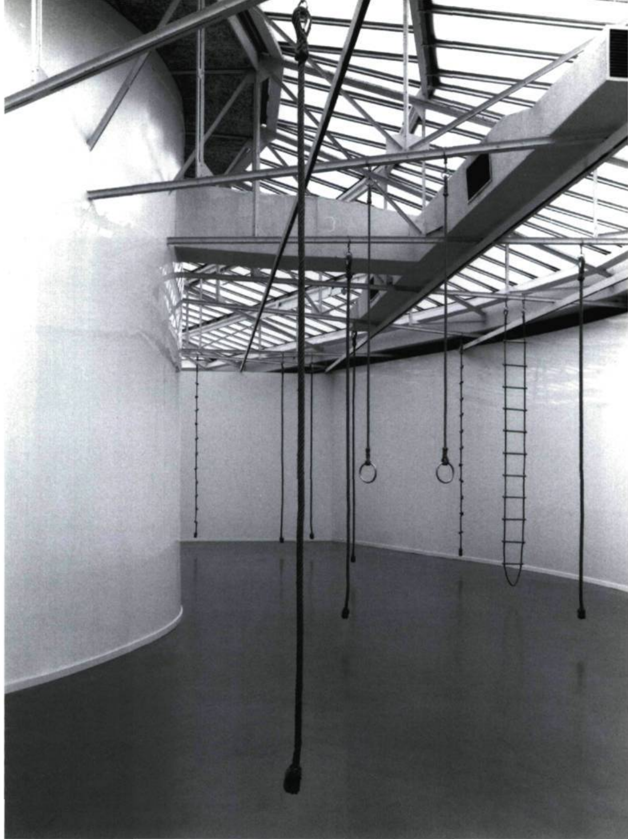
Claude Lévêque, My Way , 1996.

ou ailleurs dans les quartiers déshérités du monde. La jeunesse punk pour qui tout égale tout qui n'étant rien égale rien, ou la jeunesse rock qui hurle sa mort et celle de la société, et puis celle du rave's party des plus jeunes où la musique techno et les pulsions lumineuses vous fractionnent en vous renvoyant à la solitude totale de l'anonymat. Il n'y a plus d'histoire mais des accrocs, des reprises et des répétitions des miettes de la mémoire.