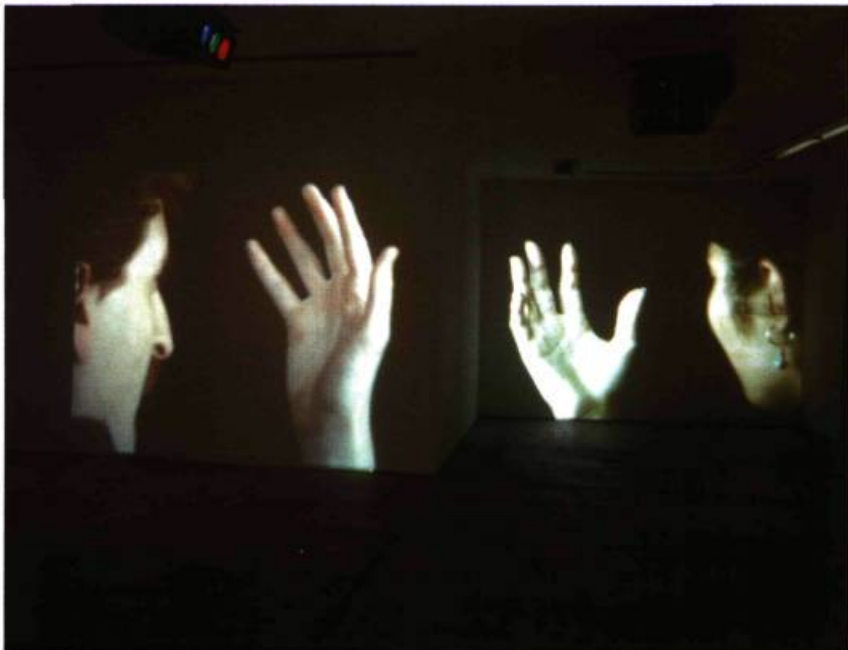
Gary Hill, Hand Heard , 1996. Vue de l'installation à la Galerie des Archives, Paris. Courtoisie Donald Young Gallery, Seattle.