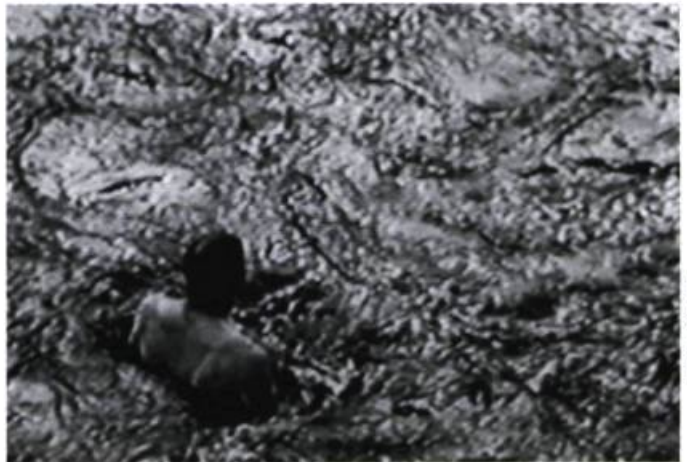
Nathalie Caron, Charles Guilbert, Les Personnes , 1997. Installation (détail).