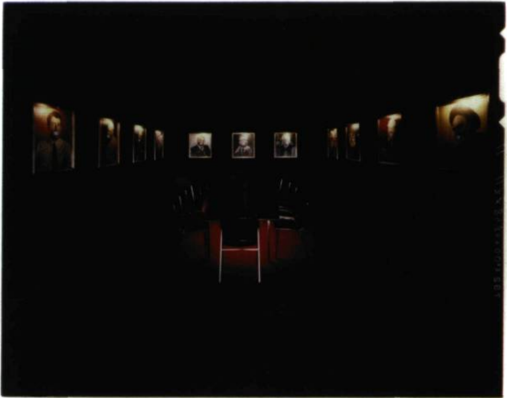
Muntadas, La salle du conseil, 1987. Coll. MBAC.