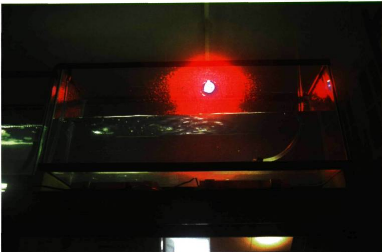
Richard Purdy, Aréochéologie , 1997. Vue de l'installation. Crêpes, échafaudages, 200 gallons d'eau, aquarium, systèmes d'éclairage, systèmes hydrauliques, briques concassées, vidéo; 87,3 m 2 .

nant. Oui ! L'eau existe sur Mars. La preuve visuelle est là. Les théories des scientifiques sur Mars sont vraies mais sont détournées pour servir la cause de l'art : « L'aréoculture ne se perpétue pas d'une manière biologique, mais d'une façon artistique seulement » (Richard Purdy).