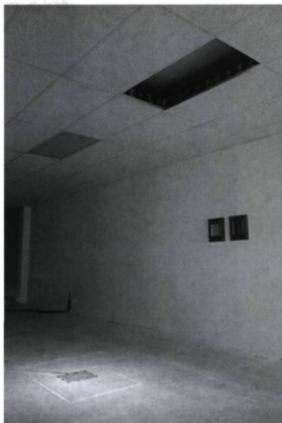
Edward Poitras, Toi mon frère , 1997.

Au sol, sont adossées d'une manière angulée, tel au mur, 14 plaques photographiques métalliques, où apparaissent les portraits transférés d'autant de visages. Leur nom ap-