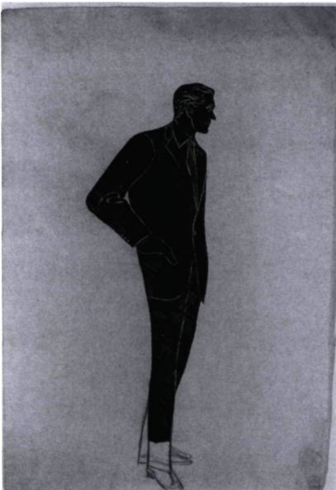
Andy Warhol, Man , 1950s. Encre et crayon sur papier; 58,1 x 39,11 cm. Andy Warhol Museum, Pittsburg. Andy Warhol Foundation.