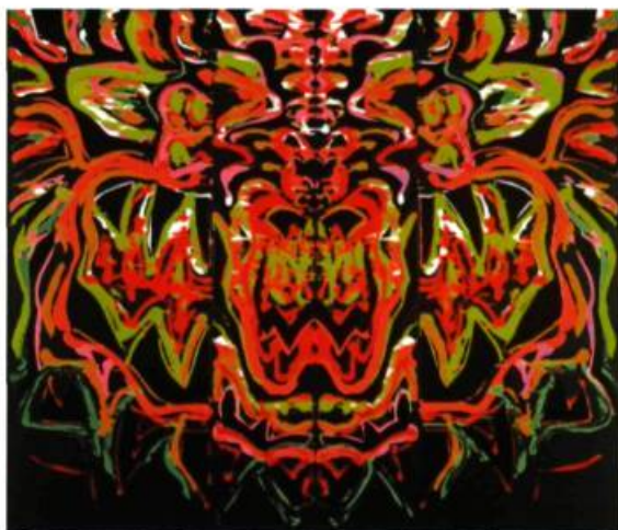
Jacques Hurtubise, Mars aux dents , 1989. Acrylique et collage sur toile. Collection de l'artiste.