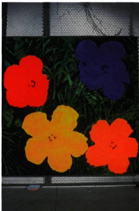
Andy Warhol, Flowers , 1964. Peinture polymère et sérigraphie sur toile; 205,4 x 205,7 cm. Andy Warhol Museum/Andy Warhol Foundation