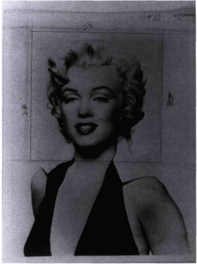
Andy Warhol, Photo publicitaire de Marilyn Monroe, avec marques de coupe de Warhol.