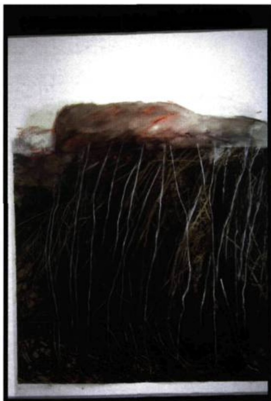
Betty Goodwin, Sans titre, nerves series , 1993. Pastel à l'huile, bâton à l'huile, cire et impression chromaflex sur Mylar, 193 x 134, 5 cm.

Il y a bien renversement des valeurs dans cette esthétique de la mort qui réaffirme « la hantise essentielle de