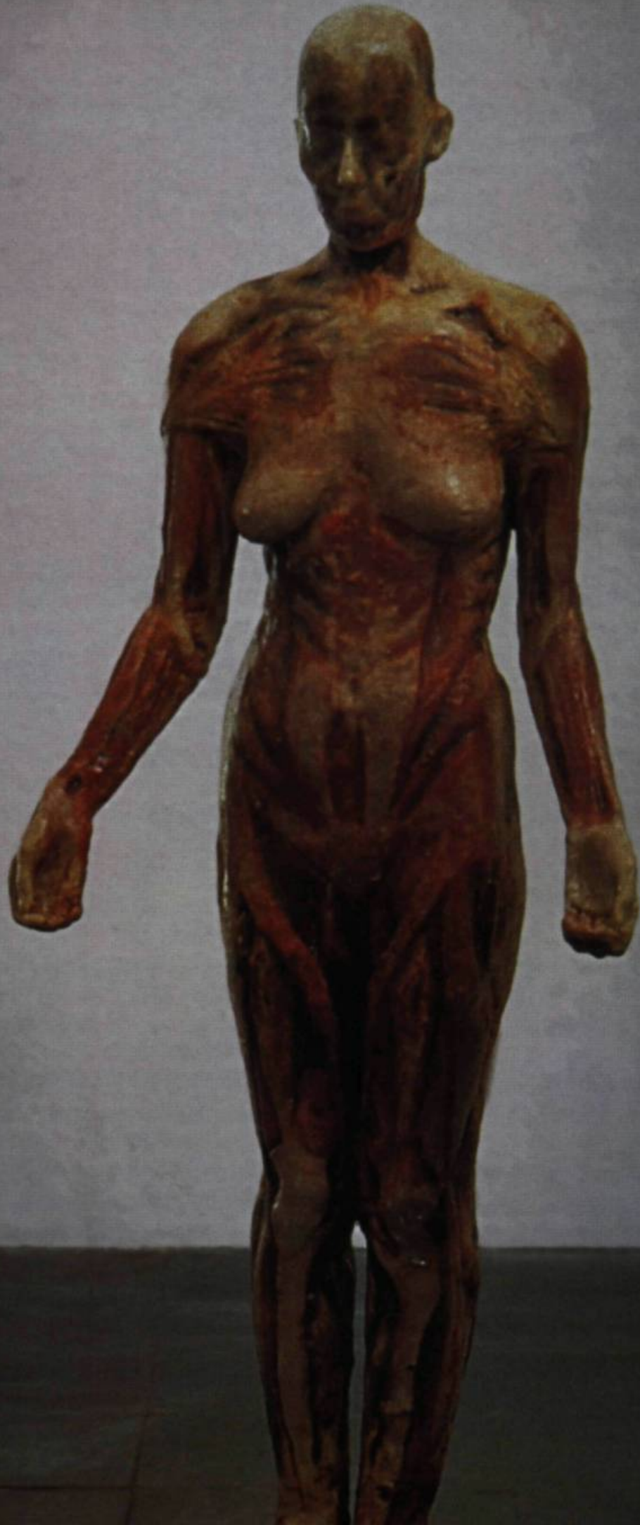
Kiki Smith, Virgin Mary , 1990. Cire et pigment, grandeur nature. Londres, Galerie Serpentine.