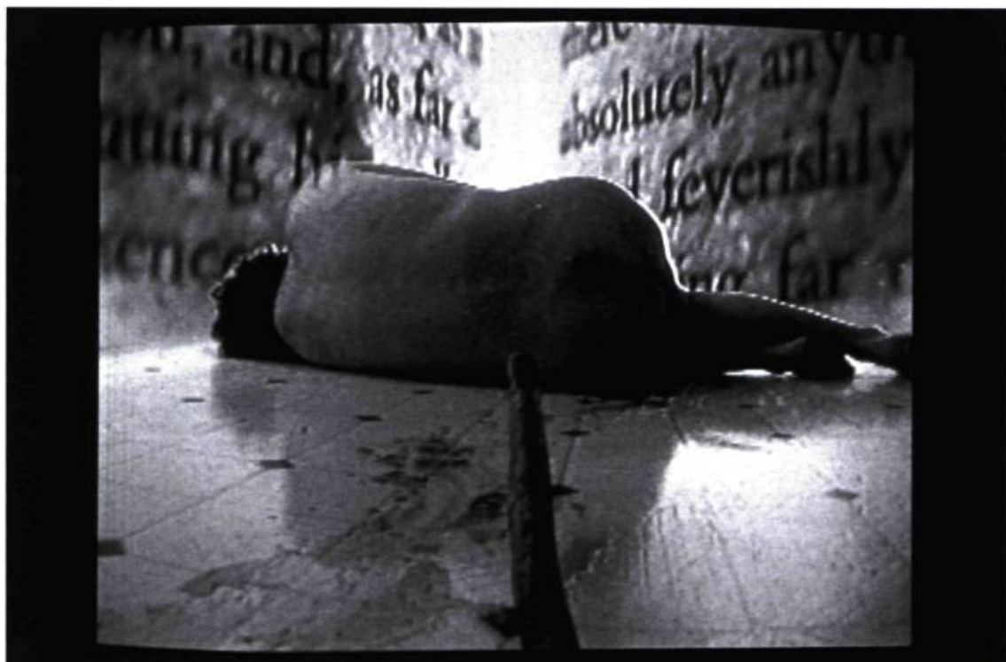
Gary Hill, Incidence of Catastrophe , 1987-1988. Vidéogramme, couleur, son, 43 min 51 sec.

la même manière qu'il est difficile d'explorer notre monde intérieur dans la confusion d'images créées par la représentation et le langage.