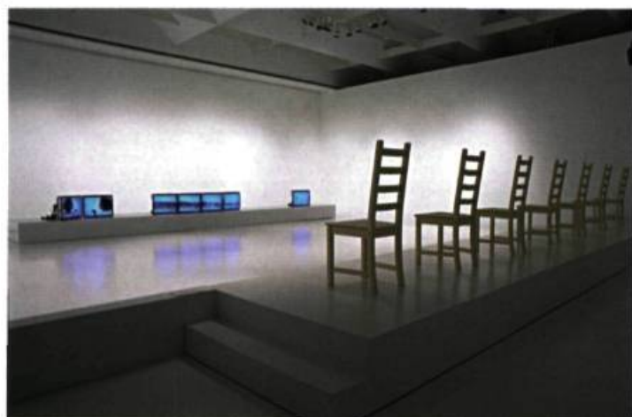
Gary Hill, Disturbance (Among the Jars) , 1988. Installation vidéographique.

part, jusqu'au moment où apparaissent des images et des textes sur une table, sous une lumière stroboscopique. C'est comme si nous assistions à la mise en mémoire d'un objet mental, sous forme de trace où l'image s'imprime sur le cortex cérébral.