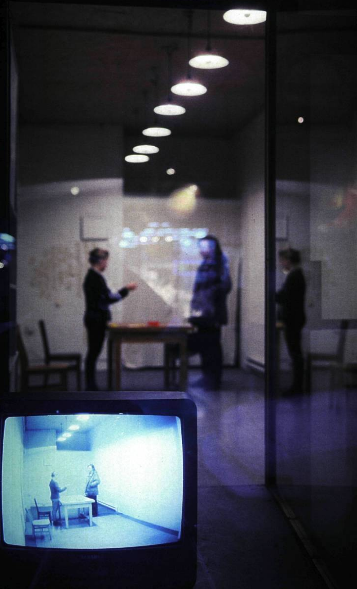
Lily Darrel, Boulevard, de l'efface , 1997. Installation-performance présentée au 3677, boulevard St-Laurent (Mtl), dans un commerce vacant ayant appartenu à une famille d'immigrants d'Europe centrale.