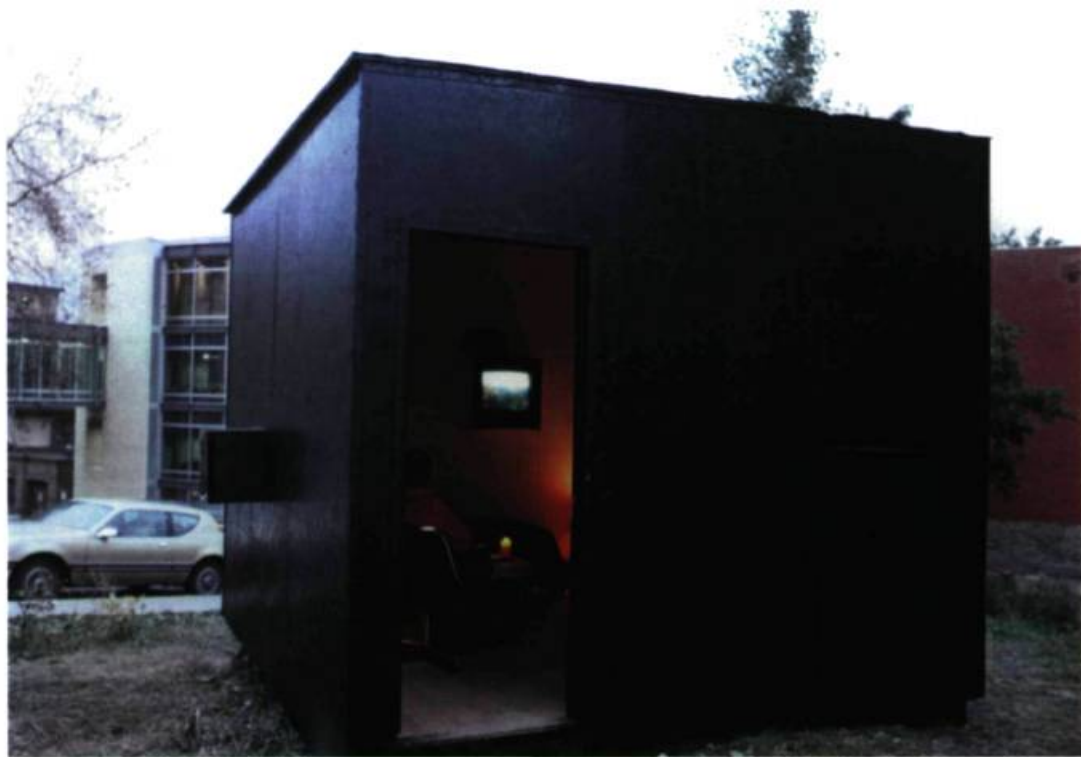
Jean-François Prost, Chambre avec vues , 1998. Installation in situ , à l'angle des rues Sherbrooke et Jeanne-Mance (Mt).

Certains disent que l'art a pour caractéristique d'être non fonctionnel et on est en droit de se demander pourquoi, quand on remarque que de plus en plus d'œuvres semblent se passionner au sujet des divers désordres qui nous unissent dans ce monde, en contribuant, par de multiples et subtiles façons, à la réflexion et à l'action.