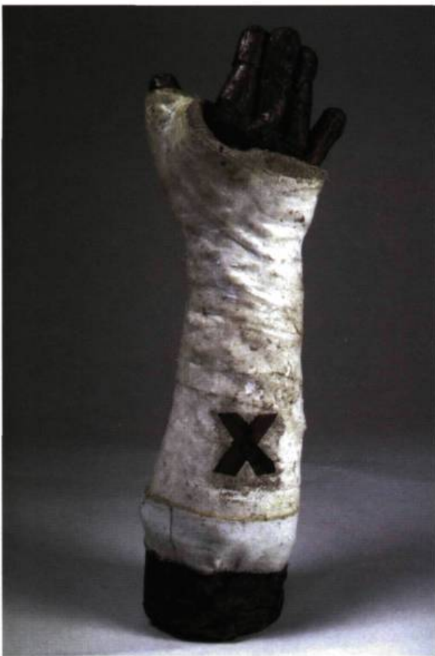
Stéphanie Béliveau, Le réfectoire , 1998. Fragment de l'installation; Plâtre, papier, carton, acrylique; 16 x 5 x 4 cm.

sera forte si elle est réussie sur les plans esthétique et philosophique.