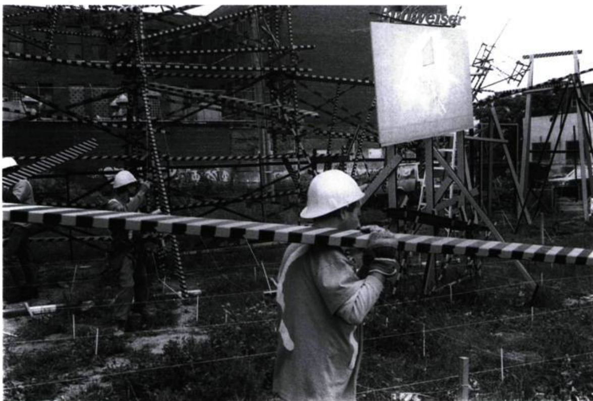
Yves Gendreau, Chantier # 365, L'intention , 1998. Intervention in situ boulevard René-Lévesque (Mtl).