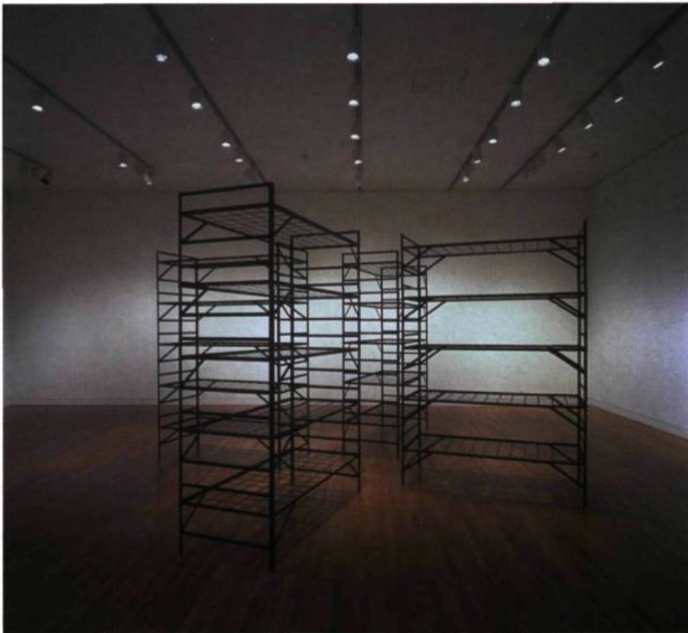
Mona Hatoun, Quartiers , 1996. Acier doux; 275, 5 x 517 x 517 cm (dimensions hors tout). Collection de l'artiste, avec l'aimable collaboration de la Galerie René Blouin, Montréal. Présentée à Traversées , Musée des beaux-arts du Canada, du 7 août au 1 er novembre 1998.

Que cherchaient les hommes et les femmes qui, par milliers, visitaient l'été dernier l'exposition Rodin au Musée du Québec ? Que pense-t-on trouver, découvrir, en franchissant la porte d'un musée ? Cette exposition comme celles consacrées à Van Gogh ou à Picasso et comme tant d'autres, attire une multitude de spectateurs, leurs promoteurs ayant réussi à transformer l'art en spectacle. Attirés par la publicité, happés par l'effet de mode, ils s'y précipitent autant que ceux qui veulent écouter un pianiste ou un violoniste célèbres, oubliant qu'il s'agit d'abord de Beethoven ou de Mozart. Or, ceux-ci résistent en dépit des promoteurs qui proposent des virtuoses.