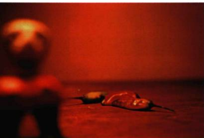
Valérie Rousseau, Sans titre , 1998.