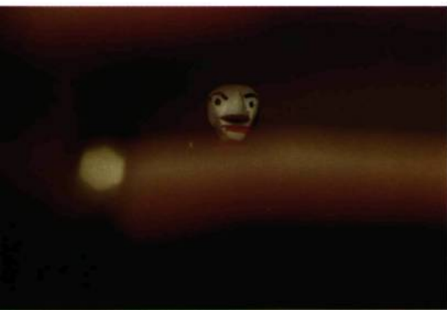
Valérie Rousseau, Sans titre , 1998.

avec les caractères généraux que cet objet se trouve posséder, que parce qu'il est en connexion dynamique (y compris spatiale) et avec l'objet individuel d'une part et avec les sens ou la mémoire de la personne pour laquelle il sert de signe, d'autre part 2 .