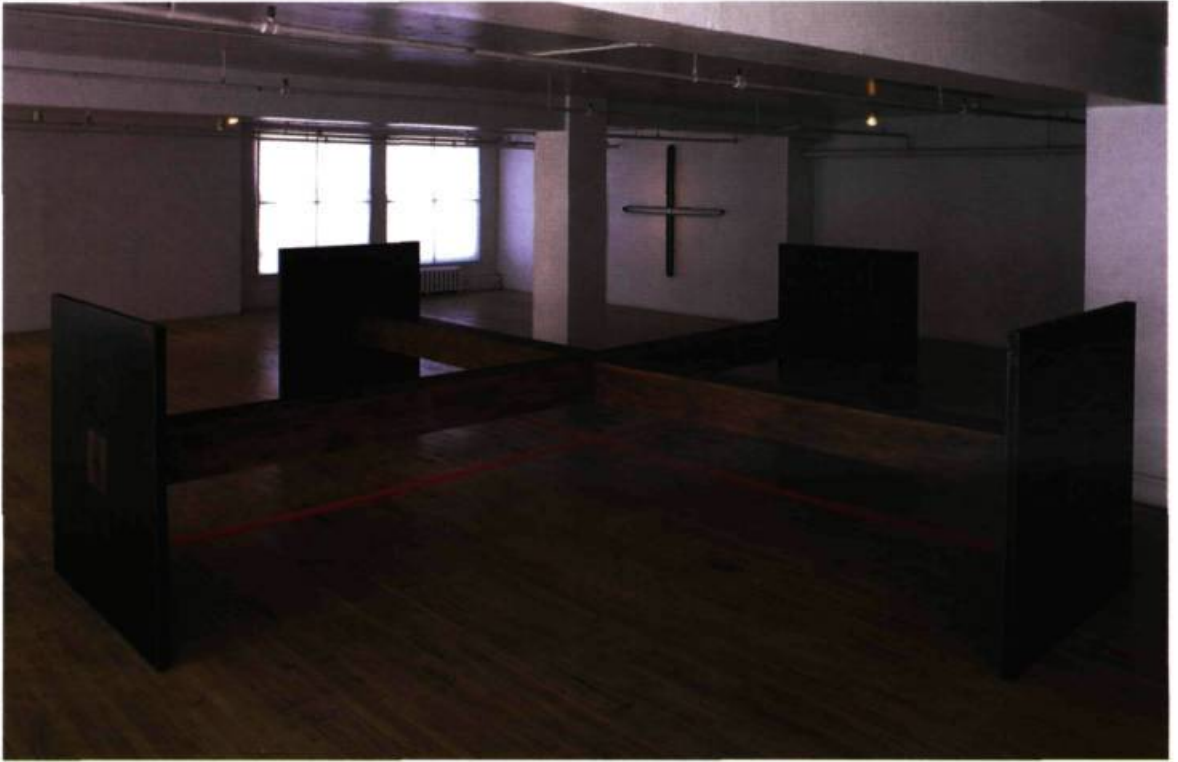
André Fournelle, L'ombre rouge , 1998. Acier, bois et pigments rouge carmin; 7m x 7m x 1,5 m (hauteur).

Cette œuvre récente de l'artiste semble s'inscrire de prime abord dans une pérennité, une logique de travail axée sur le vocabulaire architectural et la récurrence de certains motifs, telle la croix utilisée comme métaphore de l'interdit. Mais les matériaux organiques (le feu, la terre, l'eau) ou industriels (le néon) habituellement requis, sont délaissés. Cet abandon des références mythiques souligne l'épuration formelle, la référence minimaliste dans la pratique d'André Fournelle. En ce sens, le contenu métaphorique est non plus dense, mais condensé dans une volonté de dépouillement : le geste se radicalise. Cette économie du faire se double, toutefois, de cette constance dans le travail de Fournelle qu'est le déplacement esthétique/politique induit cette fois par l'aspect coercitif de l'espace de l'œuvre. Ainsi, le lieu découpé, fragmenté de L'ombre rouge , est en même temps circonscrit par quatre plaques