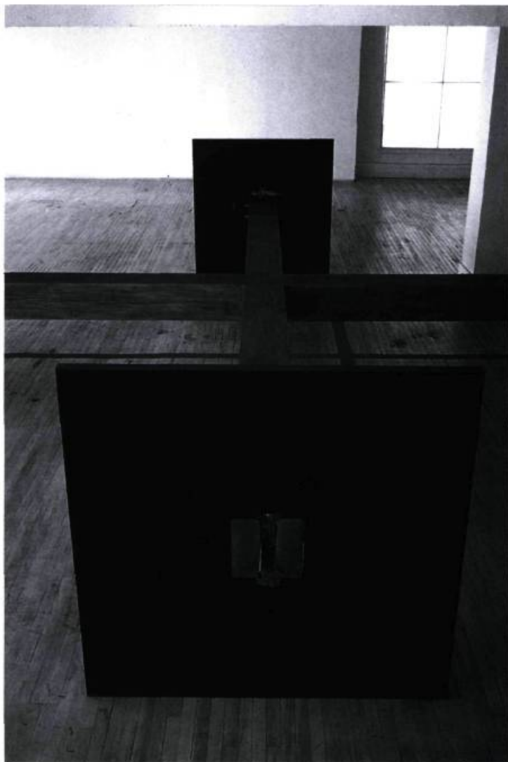
André Fournelle, L'ombre rouge , 1998. Détail. Acier, bois et pigments rouge carmin; 7 m x 7 m x 1,5 m (hauteur).

André Fournelle, L'ombre rouge , Circa, Montréal. Du 6 juin au 4 juillet 1998